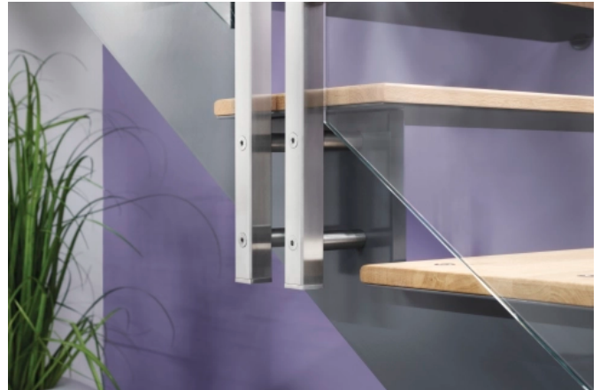
Modell Air 682b, Geprüftes Edelstahlgeländer mit Glasfüllung