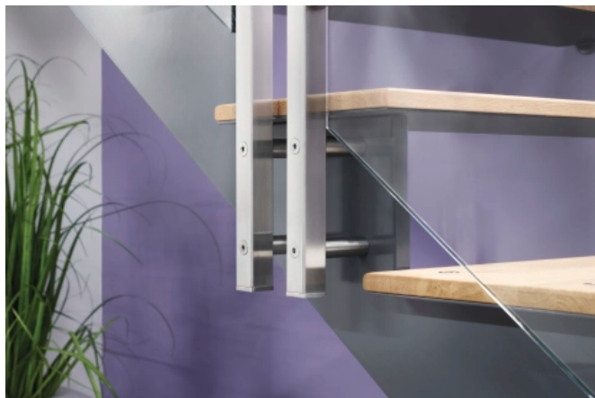
Modell Air 682b, Geprüftes Edelstahlgeländer mit Glasfüllung