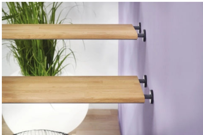
Modell Air 682a, Filigrane Stufen aus wertbeständigem Eichenholz

Aus der Serie Vielseitige Treppenmodelle von Treppenmeister