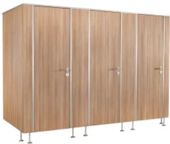
SANA Trennwandanlagen Trockenraum klassisch - Typ A30