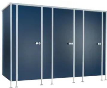
SANA Trennwandanlagen Nassraum klassisch - Typ G13