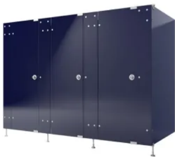
SANA Trennwandanlagen aus Glas