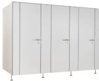
SANA Trennwandanlagen Nassraum Premium - Typ S30/S36

Aus der Serie Sanitäre Trennwandanlagen / Trennwände von SANA Trennwandbau