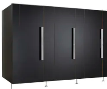
SANA Trennwandanlagen Trockenraum Premium - Typ HSV