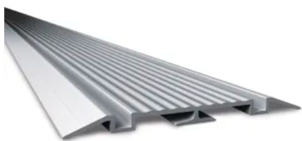
Bodenlaufschienen, aufgesetzt, flache Ausführung