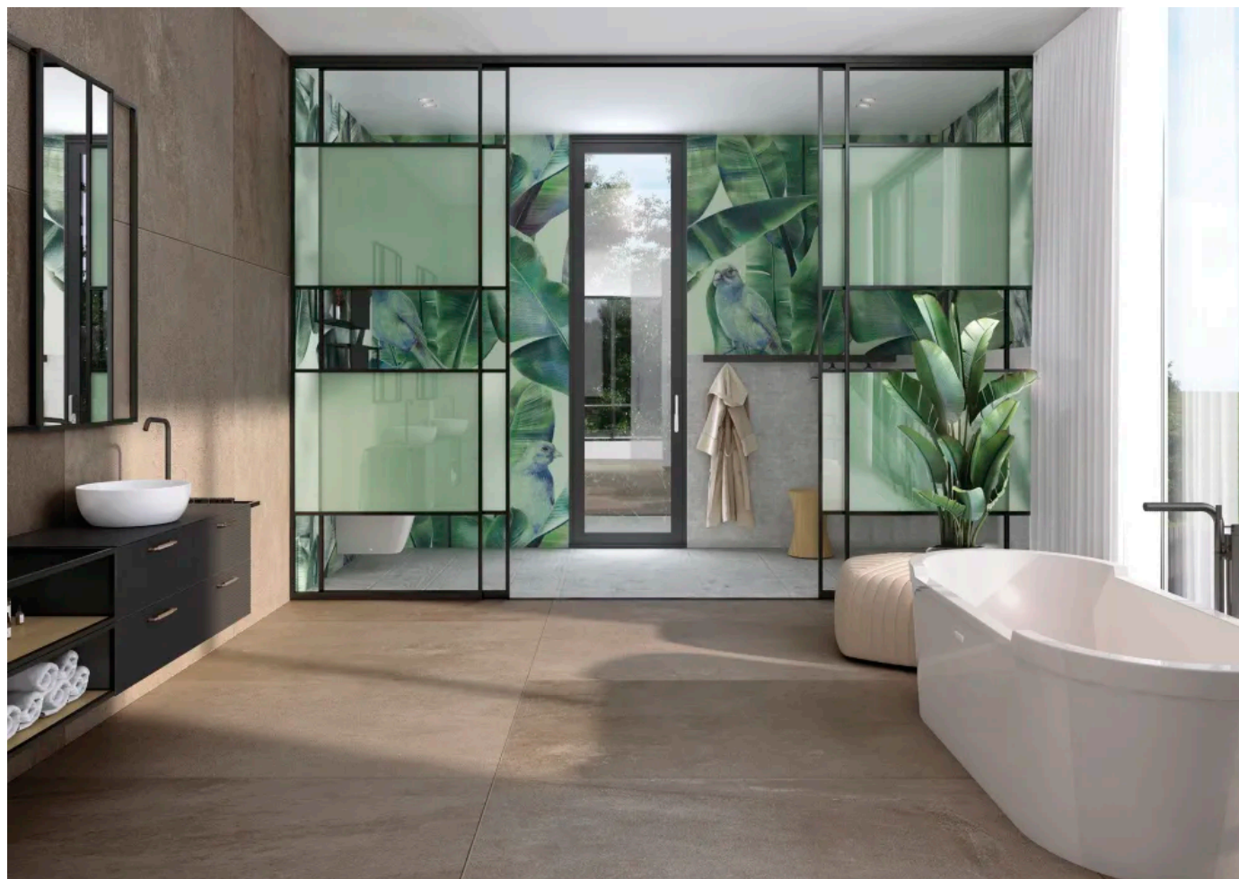
Schiebetürsystem als Raumentrenner

Aus der Serie Trennwand- und Raumgestaltungssysteme von ALUMIS