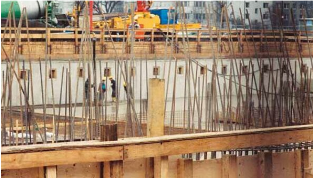
Trennmittel, Mörteldichtungsmittel, Mischöl, Mörtelfix und Haftemulsion

Aus der Serie Bautenschutz / Abdichtung von Saint-Gobain Weber