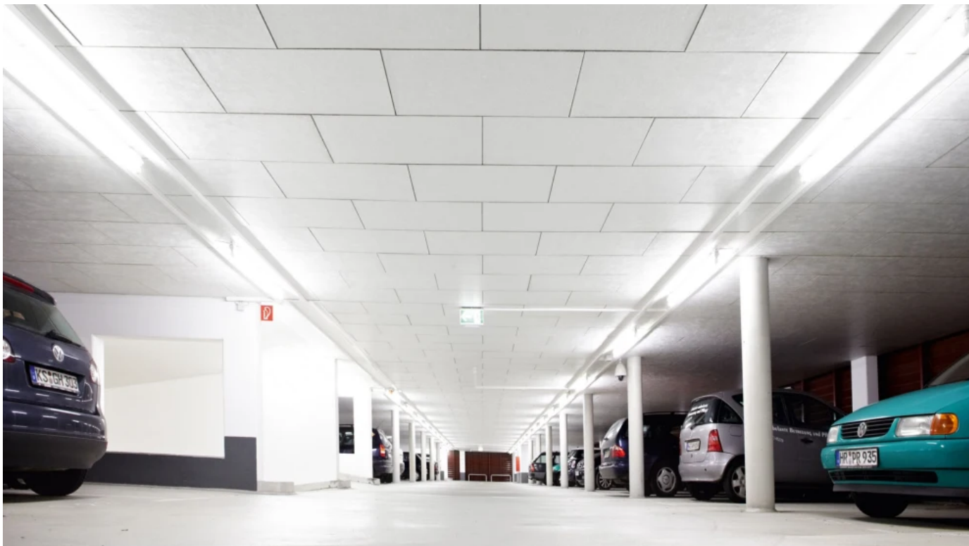
Akustik-Unterdecken, System Rockfon® Facett Elegant

Exklusive Tiefgaragendämmung mit hochwertiger weißer Oberfläche und umlaufender Fase. Verleiht der Tiefgarage eine klare Linienführung mit heller, freundlicher Optik. Halteklammermontage oder Klebmontage.