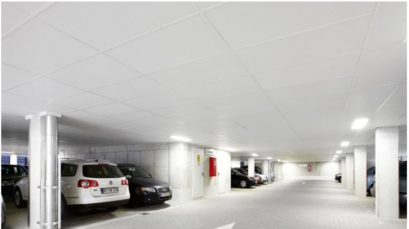
Akustik-Unterdecken, System Rockfon® Facett Plano

Tiefgaragendämmsystem bestehend aus Facett Plano und RP-Dämmauflage