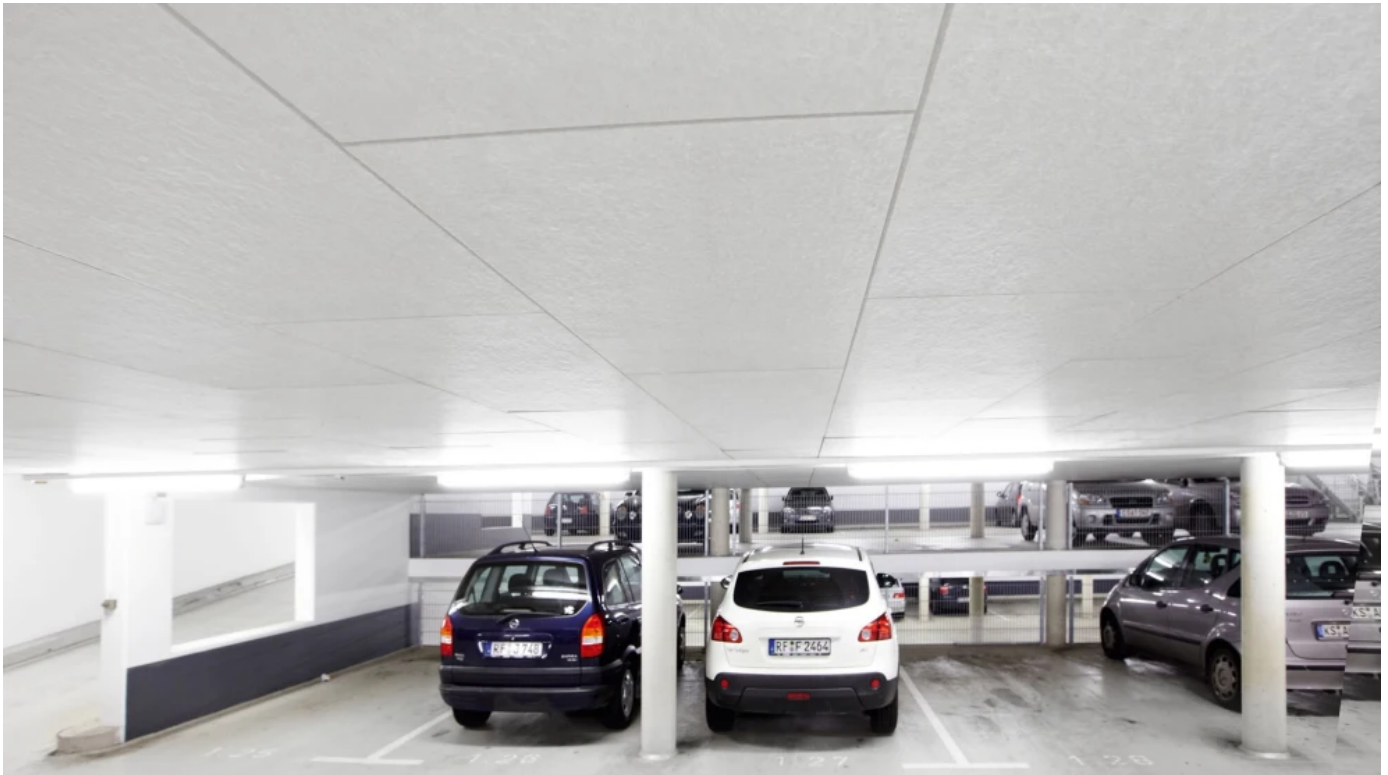
Akustik-Unterdecken, System Rockfon® Facett Klassik