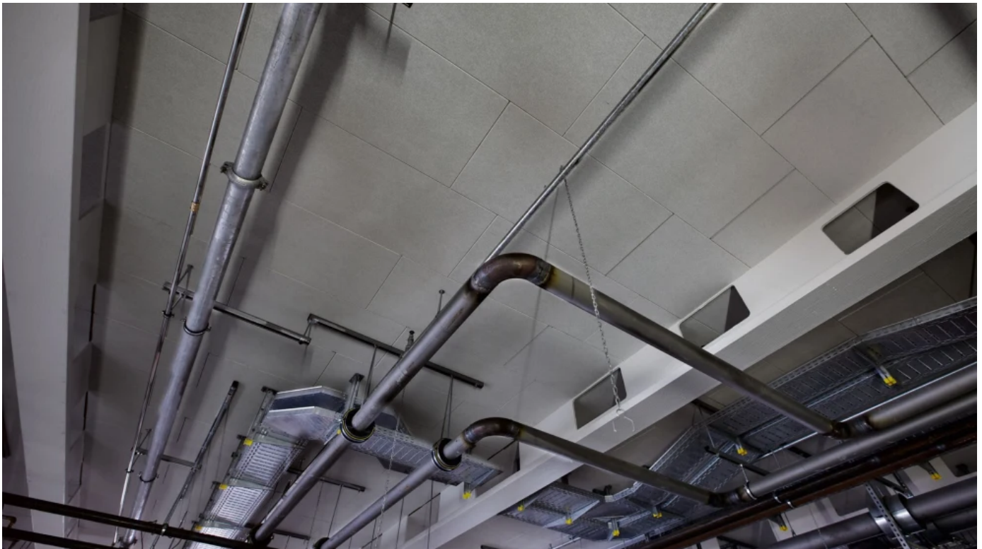
Akustik-Unterdecken, System Rockfon® Facett Pure

Funktionale Tiefgaragendämmung mit naturweißer oder schwarzer Oberfläche, ohne Anforderungen an die Optik für die Klebe- oder Dübelmontage