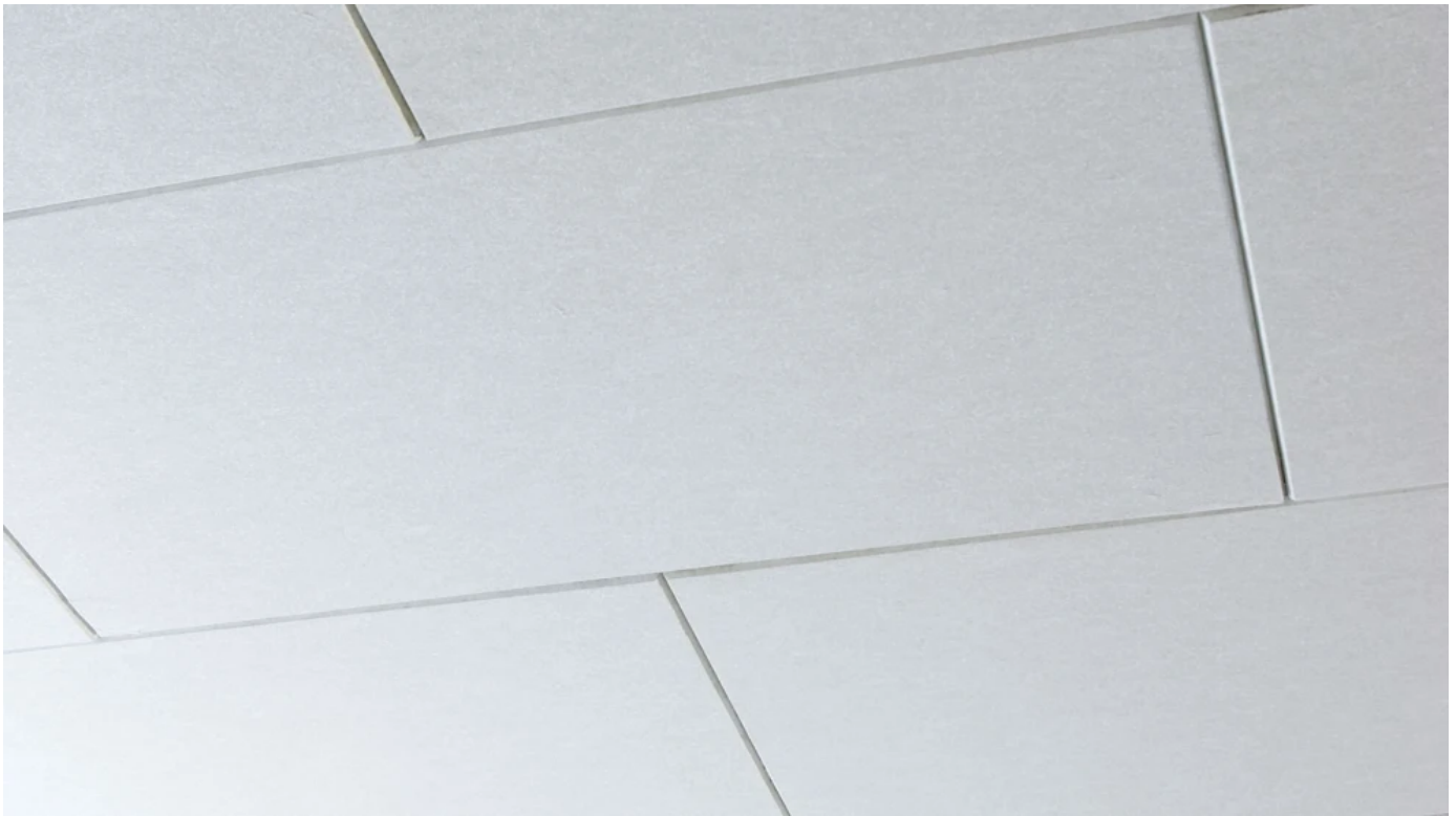
Akustik-Unterdecken, System Rockfon® Facett Brillant

Premium Tiefgaragendämmung mit hochwertiger strukturierter Oberfläche und umlaufender Fase. Halteklammermontage oder Klebmontage.