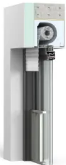
Thermo NB 4.0 TA

Raffstore, Revision außen Ohne Fliegengitter