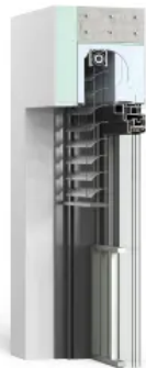
Thermo NB 4.0 TR

Rollladen, Revision außen Ohne Fliegengitter