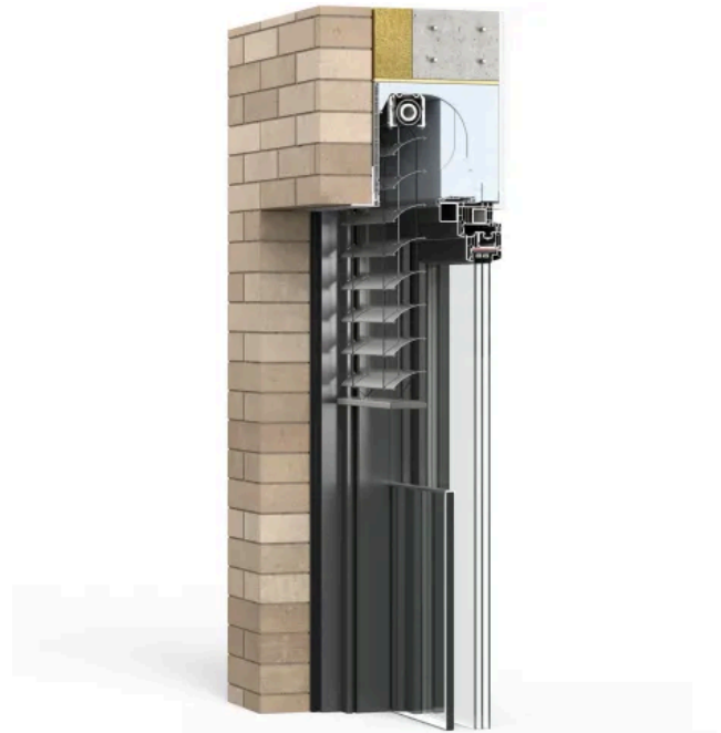
DuoTherm Absturzsicherung Thermo NB 4.0 Protection