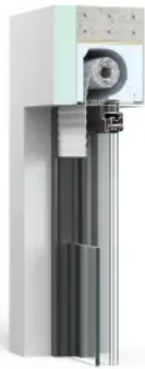
Thermo NB RA

Rollladen, Revision innen Ohne Fliegengitter