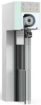
Thermo NB 4.0 TI

Aus der Serie Thermo NB 4.0® Neubauaufsatzkasten für Rollläden, Raffstore und Tuchverschattung von DuoTherm Rolläden