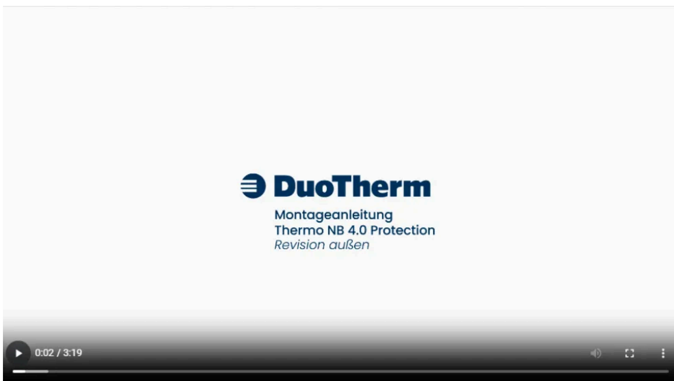
Video Thermo NB 4.0 Protection-Montageanleitung-Revision außen