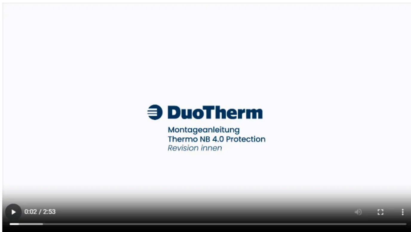
Video-Thermo NB 4.0 Protection-Montageanleitung-Revision innen

Aus der Serie Thermo NB 4.0® Neubauaufsatzkasten für Rollläden, Raffstore und Tuchverschattung von DuoTherm Rolladen