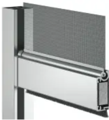
Sonnenschutzsystem heroal VS