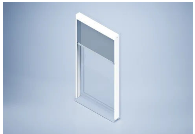
Sonnenschutzsystem heroal VS Z plus

Das Sonnenschutzsystem heroal VS Z plus ist Teil der modularen Systemlösung heroal plus und ergänzt Fenstersysteme um einen außenliegenden Sonnenschutz. Die Führungsschiene mit einer Ansichtsbreite von 34 mm und integrierter Kastentiefe ist ein zentrales Element des modularen Konzepts. Sie ermöglicht die sichere Führung des textilen, Zip-geführten Sonnenschutzes und die Integration zusätzlicher Funktionen. Eine Absturzsicherung kann direkt im Vorbausystem umgesetzt werden, ohne zusätzliche Bauteile an der Fassade. Außerdem besteht die Möglichkeit, ein manuell bedienbares Insektenschutzrollo im Kasten zu integrieren. Optional kann eine Fensterbank ergänzt werden. Das System ist witterungsbeständig, die Führungsschienen sind schlagregendicht und verfügen über ein bewährtes Konzept zur Wasserableitung.