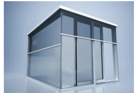
Zipscreen-System heroyal VS Z Ecklösung

Die heroyal VS Z Ecklösung besteht aus zwei Textilscreens mit Zip-Führung an den Seiten und einer Seilführung im Eckbereich, die für effizienten Sonnenschutz an Ecken (z. B. Ganzglasecken) sorgen. Besonders raffiniert: Der Behang wird mit separaten Endleisten geführt, die beide in nur einer Seilführung verlaufen. So lassen sich die Screens unabhängig voneinander steuern und können variabel an den Stand der Sonne angepasst werden.