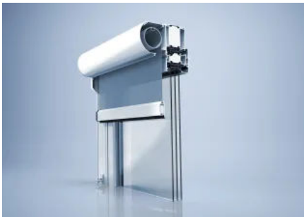
Sonnenschutzsystem heroal VS C