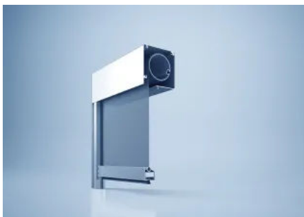
Zipscreen-System heroal VS Z