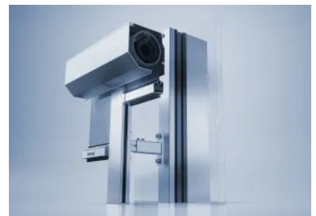
Vollintegriertes Sonnenschutzsystem heroyal VS Z CS vorgesetzt

Um das Sonnenschutzsystem heroyal VS Z nahtlos in Pfosten-Riegel-Fassaden wie heroyal C 50 zu integrieren, wurde heroyal VS Z CS (Curtain Wall Screen) mit der Führungsschiene heroyal GR 37 entwickelt. Das System kann auf gängige Pfosten-Riegel-Systeme mit mind. 50 mm Ansichtsbreite als klassische Vorbaumontage mittels Standard-Sonnenschutzbolzen montiert werden. Den Anschraubgrund für heroyal VS Z CS bieten Traversen in unterschiedlichen Längen. Durch den individuellen Abstand zur Fassade kann es z. B. auch vor Absturzsicherungen eingebaut werden.