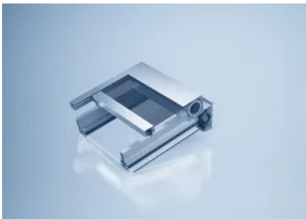
Horizontalmarkise heroal HS (© heroal)