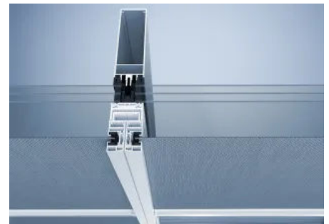
Sonnenschutzsystem heroyal VS Z CZ teilintegriert

Um das Sonnenschutzsystem heroyal VS Z nahtlos in Pfosten-Riegel-Fassaden wie heroyal C 50 zu integrieren, wurde heroyal VS Z CS (Curtain Wall Screen) mit der Führungsschiene heroyal GR 25 entwickelt. Das System kann auf gängige Pfosten-Riegel-Systeme mit mind. 50 mm Ansichtsbreite als klassische Vorbaumontage mittels Standard-Sonnenschutzbolzen montiert werden. Den Anschraubgrund für heroyal VS Z CS bietet ein Integrationsprofil, welches schon in der Werkstatt mit den Fassaden-Pfosten bearbeitet werden kann.