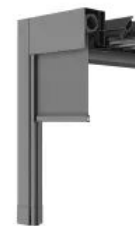
VENTUR SIDE Senkrechtbeschattung max. Breite: 6000 mm max. Ausfall: 3000 mm 18 m 2