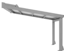
SINTESI Pergola - max. Breite: 6000 mm max. Ausfall: 6500 mm max. Säulenhöhe 3500 mm