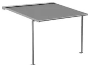
ELEGANZA protect Pergolamarkise max. Breite 6000 mm max. Ausfall 5500 mm 26 m 2