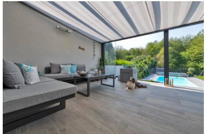
Granitkeramikplatte Xantos® in graubraun-meliert