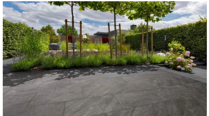
Arctia Keramik Terrassenplatten anthrazit-meliert