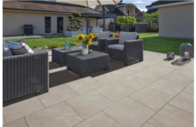
Matera - Granitkeramikplatte