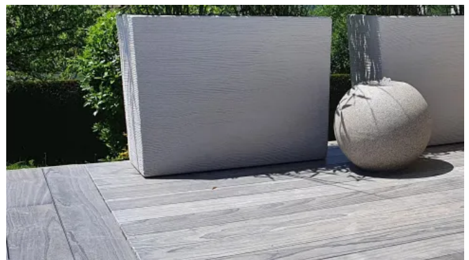
Accoya® – Terrassendielen, grau durchgefärbt