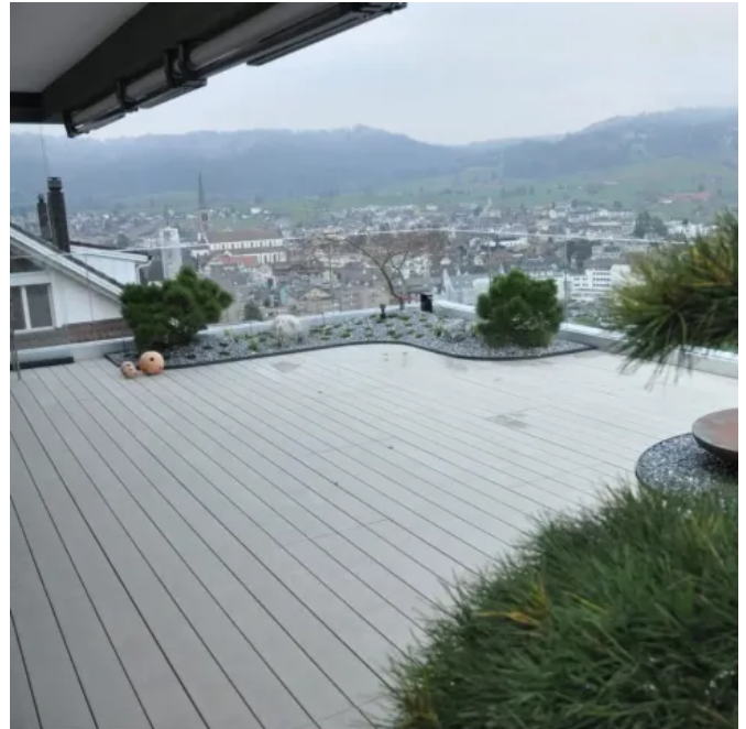
Accoya® – Terrassendielen aus acetylierter Radiata Pine, grau durchgefärbt