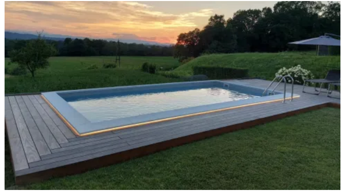
Accoya® – Terrassendielen aus acetylierter Radiata Pine