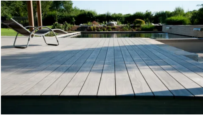
Accoya® – Terrassendielen aus acetylierter Radiata Pine

Aus der Serie Terrassendielen, Fassadenbekleidungen und Fenster aus acetyliertem Holz von Accoya