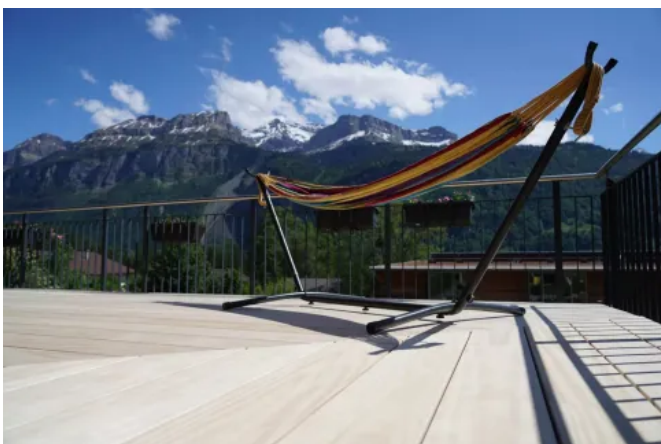
Terrassendielen aus acetylierter Radiata Pine

Acetyliertes Holz wird mit ungiftiger, natürlicher Essigsäure (Acetylsäure) modifiziert. Die Holzzellen nehmen dadurch deutlich weniger Wasser auf. Die Haltbarkeit und Stabilität des Rohholzes wird deutlich verbessert, die Nutzungsdauer verlängert und der Kohlenstoff bleibt länger gebunden. Anders als beim Thermoholz wird das Material durch die Behandlung nicht weicher. Zugleich nimmt es auch keine dunklere Farbe an. Acetyliertes Holz ist ähnlich witterungsbeständig wie Tropenholz und sehr haltbar.