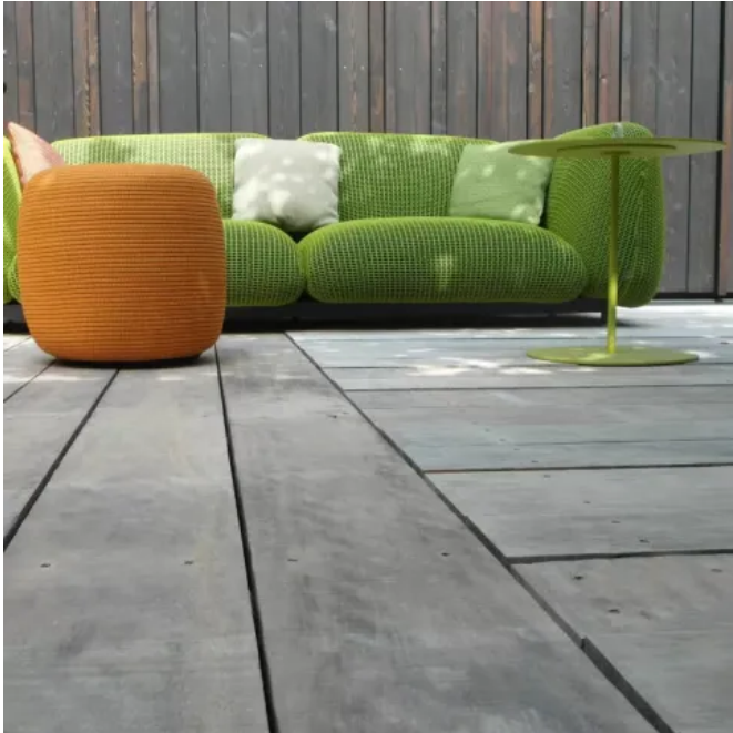
Accoya® – Terrassendielen aus acetylierter Radiata Pine, grau durchgefärbt

Aus der Serie Terrassendielen, Fassadenbekleidungen und Fenster aus acetyliertem Holz von Accoya