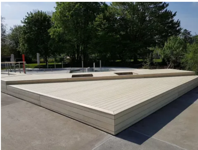
Accoya® – Terrassendielen aus acetylierter Radiata Pine