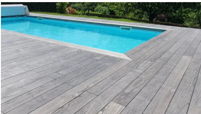
Accoya® – Terrassendielen, grau durchgefärbt

Accoya Color Grey Terrassendielen werden aus grau durchgefärbtem Accoya®-Holz hergestellt. Die Holzterrassen mit barfußfreundlichen Oberflächen und besonders lang anhaltender grauer Farbe benötigen kaum Wartung oder Pflege.