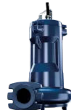
Sanipump VX 65/80