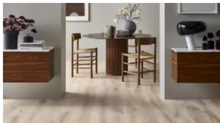
Heritage Landhausdielen (14 mm)

Das exklusive Erscheinungsbild der Heritage Landhausdielen (14 mm) wird von "natürlichen Fehlern" geschaffen. Die rustikalen Eiche Dielen weisen große Äste und dunkle Risse auf und besitzen aufregende Variationen in Farbe und Struktur. Um die Details zu betonen, werden die Holzmaserungen durch tiefes Bürsten und Beizen hervorgehoben und mit einem Hartwachsöl behandelt.