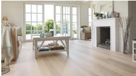
Prestige (14 mm)

Aus der Serie Parkett von Tarkett Holding