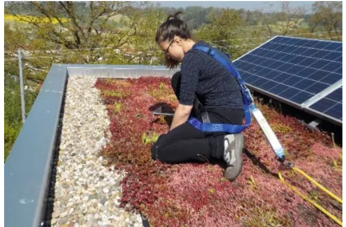
Optigrün international AG – Göggingen