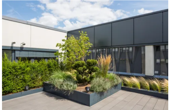
Adam Hall Group – Neu-Anspach