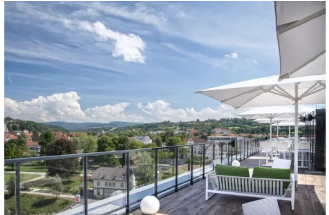
Hotel am Remspark – Schwäbisch Gmünd