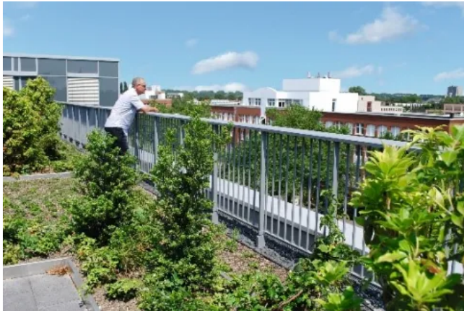
Optigrün international AG – Göggingen

Aus der Serie Funktionsbegrünung von Optigrün