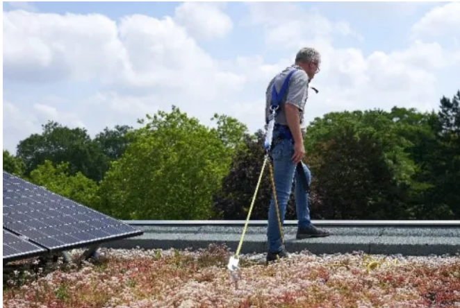
Wohnbebauung Jaczostraße – Berlin

Aus der Serie Funktionsbegrünung von Optigrün