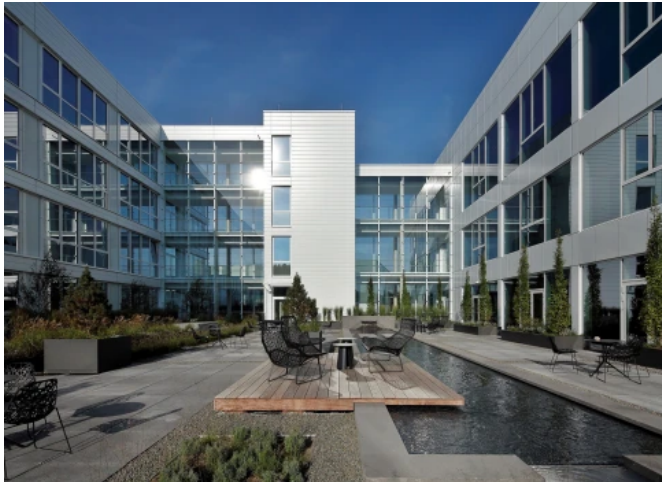
ABUS Kranssysteme, Gummersbach

Aus der Serie Funktionsbegrünung von Optigrün