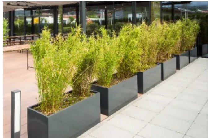
Adam Hall Group – Neu-Anspach