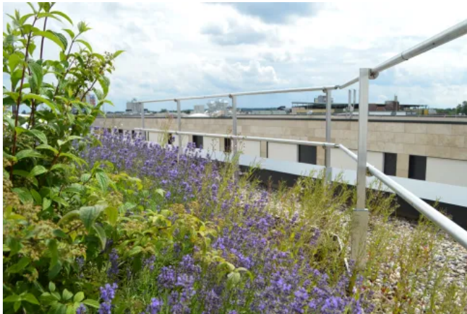
Einkaufszentrum – Hanau