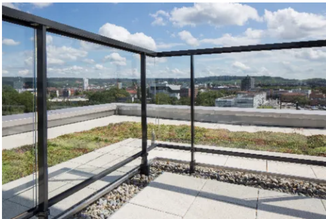
BUGA – Heilbronn