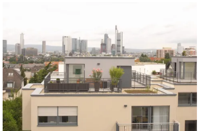
Goetheblick – Frankfurt