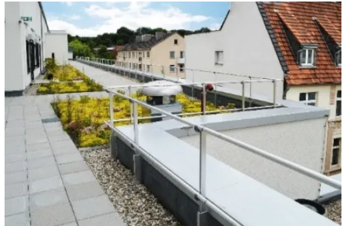
Rathausgalerie – Haagen