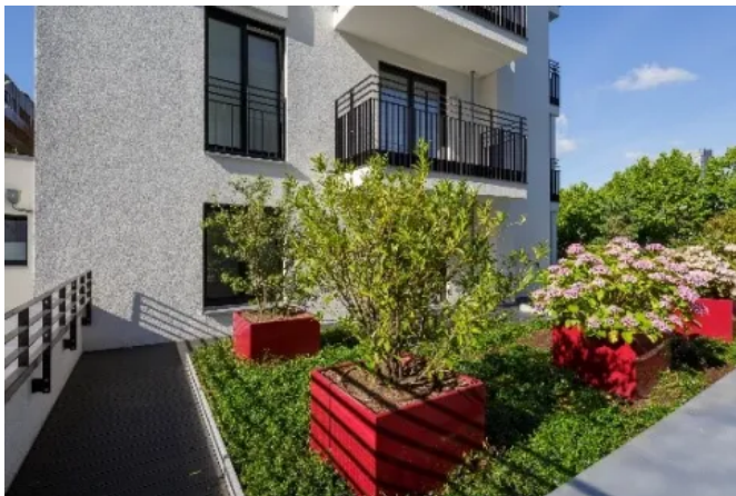
Patio GmbH - Schorndorf