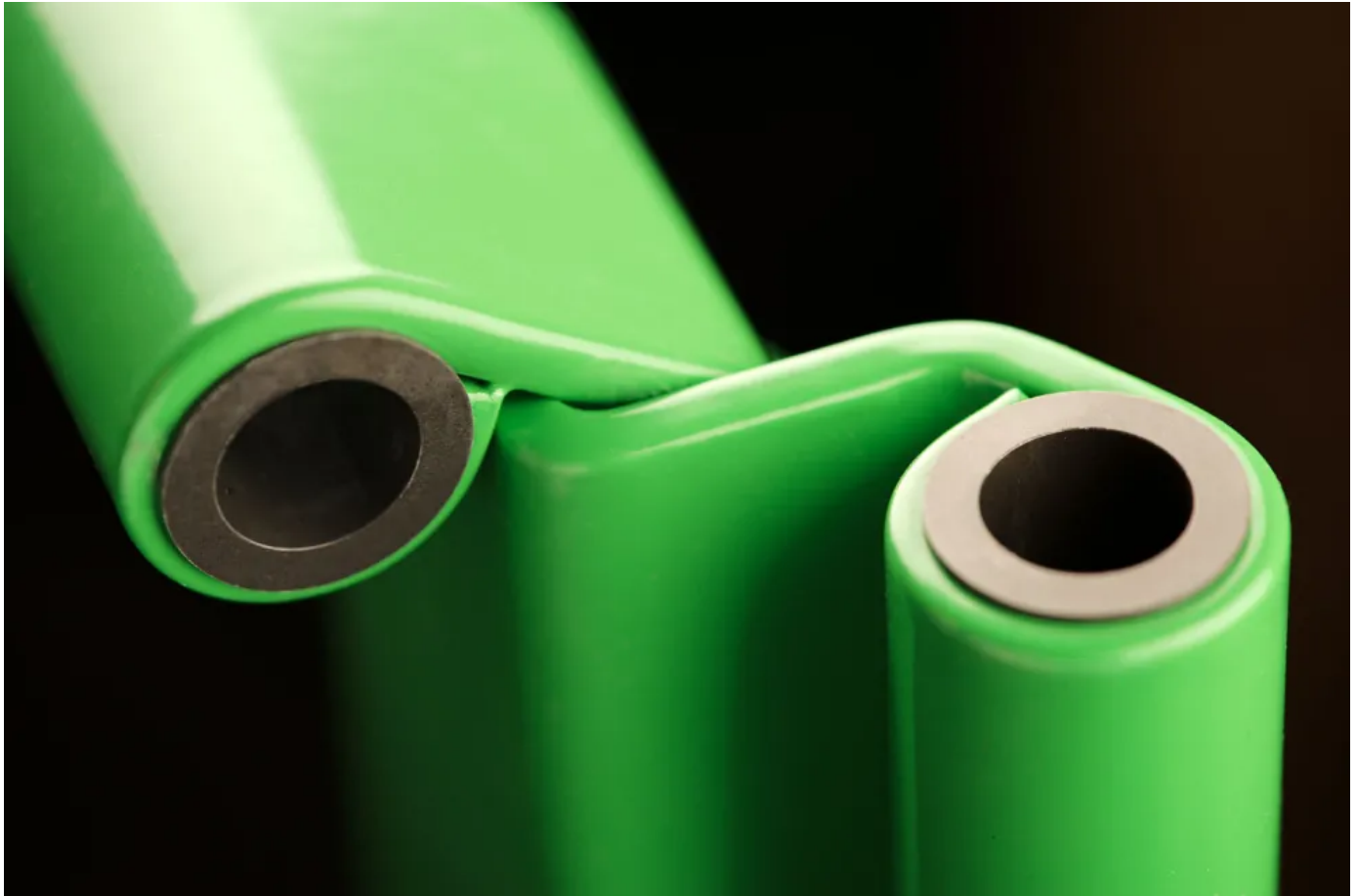
Patentgeschütztes Leichtlauflager für System Schröders Leichtlauftüren

Aus der Serie Türen und Tore mit Drehflügel von System Schröders Türen + Tore