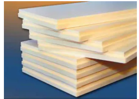
Sundolitt® XPS 300 kPa Stufenfalz