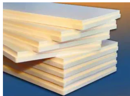
Sundolitt XPS 700 kPa Stufenfalz

Technisches Datenblatt: Sundolitt XPS 700 kPa Stufenfalz — Longboard