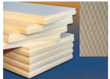
Sundolitt® XPS 300 kPa Waffelstruktur