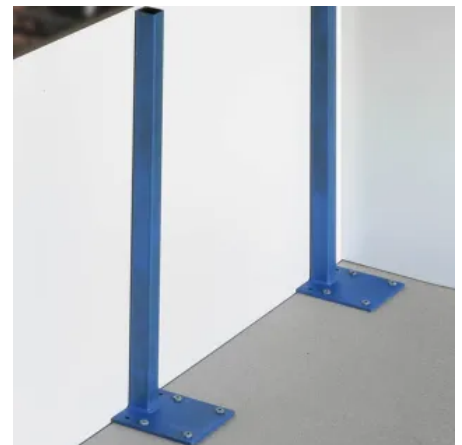
Wandintegrierte Brüstungsstütze freistehend