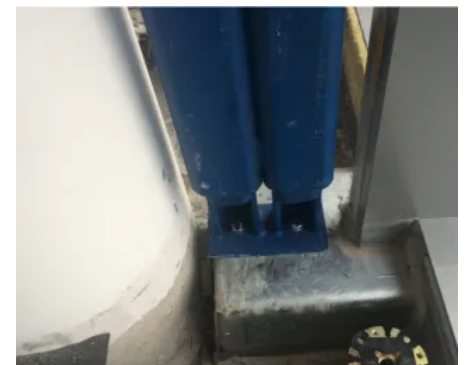
Einzelne wandintegrierte Statikstütze