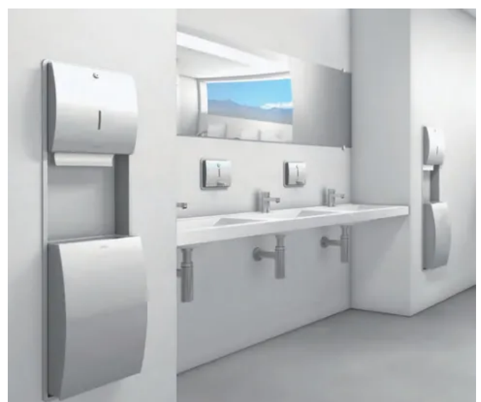
Beispielhafter Sanitärraum: ausgestattet mit STRATOS Unterputzprodukten, MIRANIT Reihenwaschtisch, Selbstschluss- und Sensor-Armaturen