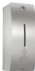
Elektronischer Desinfektionsmittelspender STRX627

Optional Standsäule aus Chromnickelstahl mit schwarzer Kunststoff-Tropfschale.