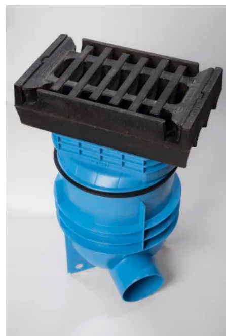
RAINSPOT Straßenablauf mit Aufsatz