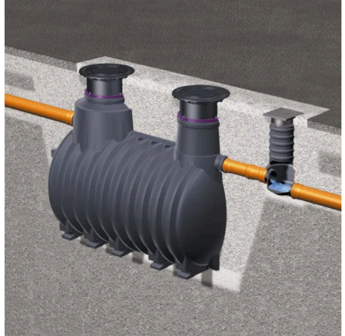
Stärkeabscheider EasyStarch ground NG 2 für den Erdeinbau