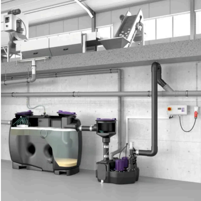
Stärkeabscheider EasyStarch free NG 2 für die Freiaufstellung

Aus der Serie Abscheidetechnik für Industrie und Gewerbe von KESSEL Entwässerungstechnik