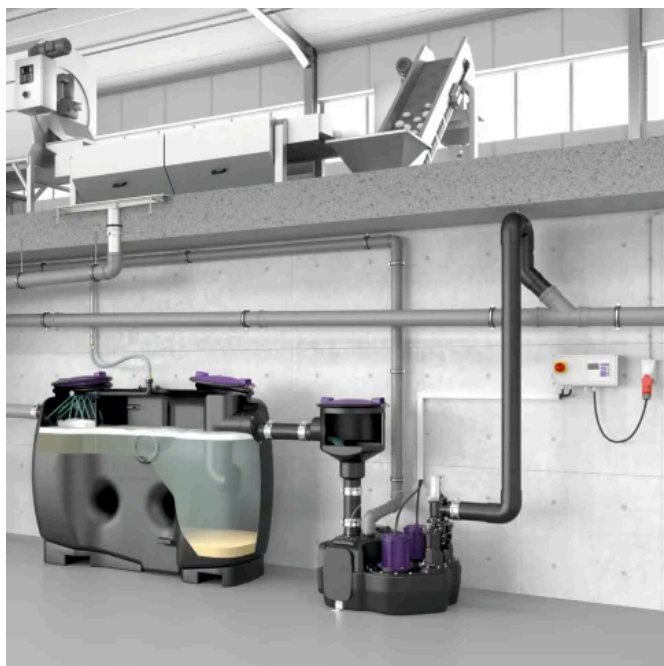
Stärkeabscheider EasyStarch free NG 2 für die Freiaufstellung

Aus der Serie Abscheidetechnik für Industrie und Gewerbe von KESSEL Entwässerungstechnik