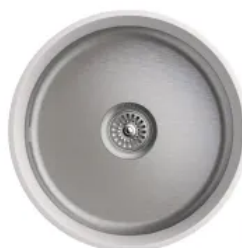
Rundspüle D/T 413/175 mm