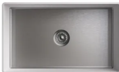
XL Spülen R10 L/B von 700/413 mm bis 903/416 mm