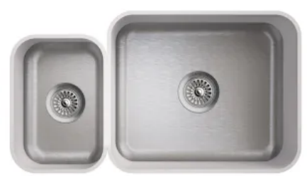
Doppelspülen R60 L/B von 525/413 mm bis 866/413 mm