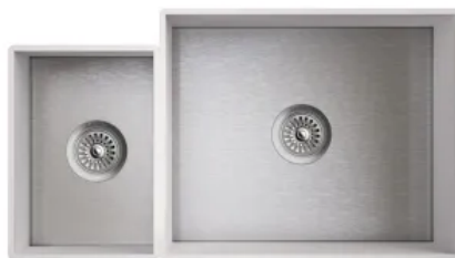
Doppelspülbecken R0 L/B von 533/413 mm bis 874/413 mm