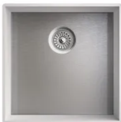
Einzelspülen R0 L/B von 168/352 mm bis 500/413 mm

R0 Spülen eignen sich für Raumkonzepte mit minimalistischer Küchengestaltung.