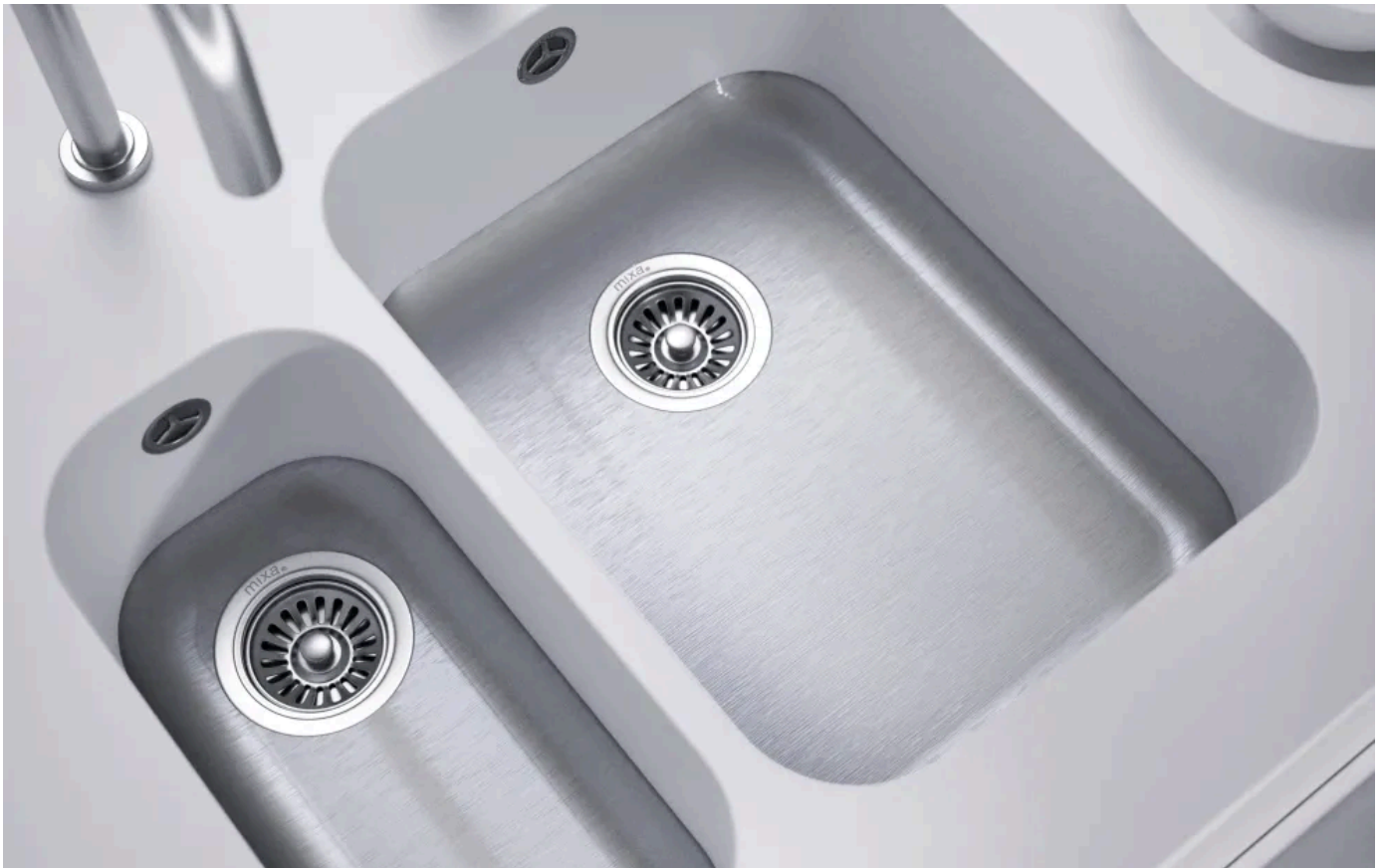
MIXA® R60 rund

Die Radius 60 Spülen eignen sich für Einrichtungskonzepte ohne Ecken und Kanten mit einem Fokus auf unkomplizierte Reinigung und Pflege.