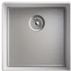
Einzelspülen R10 L/B von 168/352 mm bis 500/413 mm

MIXA R10 Spülen fügen sich in Interiorkonzepte mit puristischem Design ein. In den großen R10 XL Spülen lassen sich auch sperrige Küchenutensilien wie Grillroste, Backbleche oder Bräter einfach reinigen.