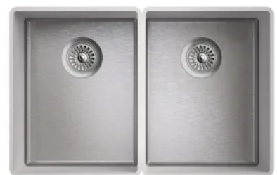
Doppelspülen R10 L/B von 533/413 mm bis 874/413 mm