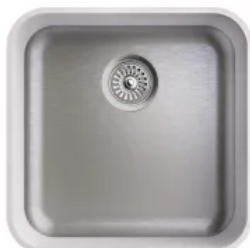
Einzelspülen R60 L/B von 168/352 mm bis 500/413 mm

Die Radius 60 Spülen eignen sich für Einrichtungskonzepte ohne Ecken und Kanten mit einem Fokus auf unkomplizierte Reinigung und Pflege.