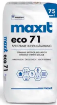
maxit eco 71 Spritzbare Innendämmung