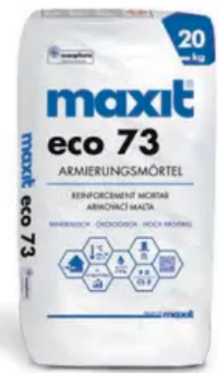
maxit eco 73 Armierungsspachtel | 20 kg