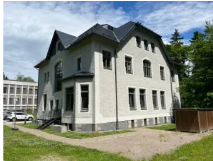
Forstliches Bildungszentrum Bad Reiboldsgrün Ort: Auerbach Produkt: maxit eco 72 ca. 430 m 2