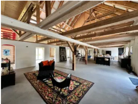
Farmhaus (ehem. Pferdestall) Ort: Warthe, Lieper Winkel, Usedom Produkt: maxit eco 71 ca. 2 t (~ 14.400 l)