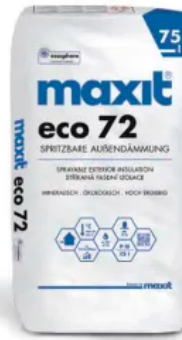
maxit eco 72 Spritzbare Außendämmung