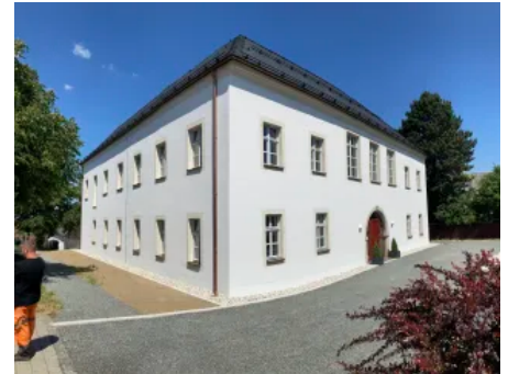
Neues Schloss Waldthurn Ort: Lobkowitz Produkt: maxit eco 72 ca. 7 t (~ 50.400 l)