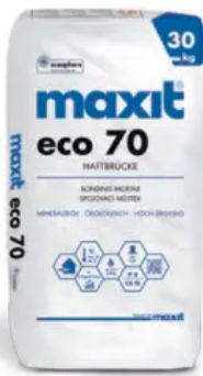
maxit eco 70 Haftbrücke