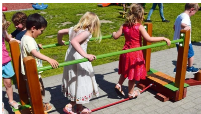
Abenteuerpfad für Kleinkinder