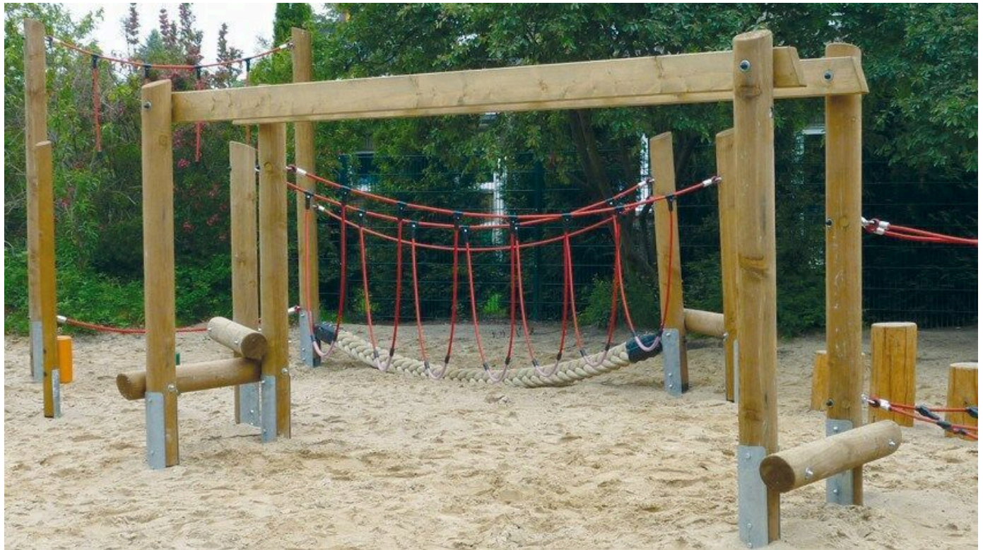
Variable Spielgeräte aus Holz.

Aus der Serie Spielplatz- und Spielanlagengeräte von HST-Spielgeräte