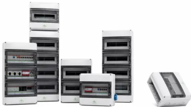
Kleinverteiler AK — AK F

Aus der Serie Systeme für die Elektroinstallation von Spelsberg