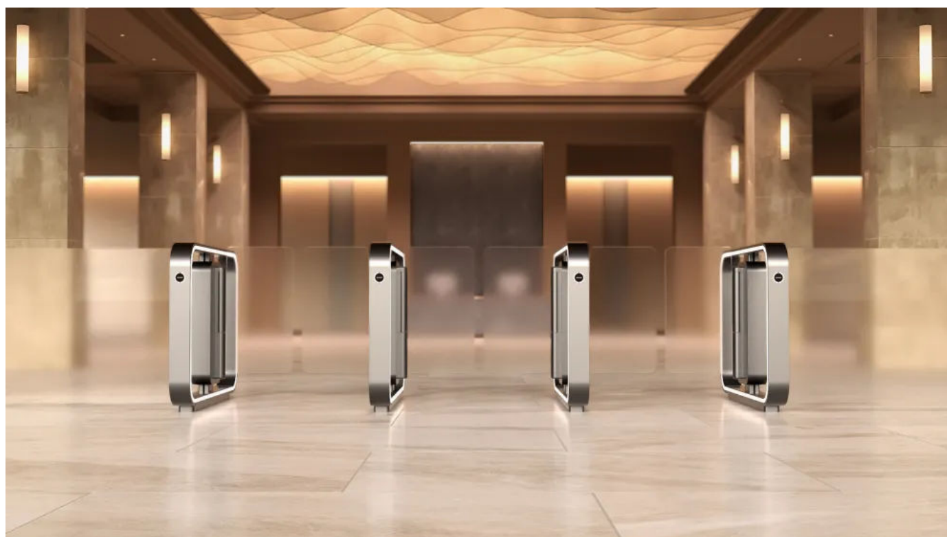
ASSA ABLOY SG Expression in weißaluminium