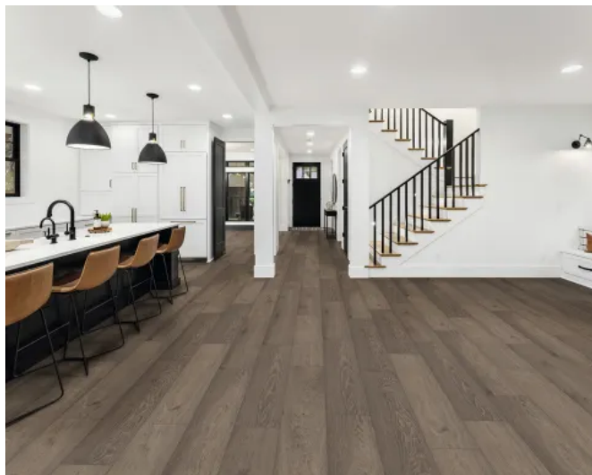
SPC-Boden SOLID PRO S345 AS Eiche Olbia