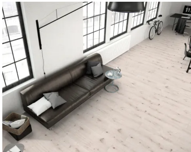
SPC-Boden SOLID PRO S340 AS Eiche Napoli Solid

Aus der Serie Fußböden - Kaindl Flooring von Kaindl