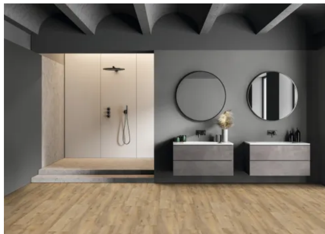
SPC-Boden SOLID S357 BW Eiche Elvas

Die Produktlinie SOLID PRO umfasst SPC-Böden mit hochauflösenden Holzdekoren, die sich optisch kaum von Echtholz unterscheiden lassen. Die Böden zeichnen sich durch eine hohe Widerstandsfähigkeit gegenüber Feuchtigkeit, Schmutz und mechanischer Beanspruchung aus. Sie sind formstabil, abriebfest und für stark frequentierte Bereiche geeignet. Der mehrschichtige Aufbau mit angenehmer Oberflächenstruktur gewährleistet einen hohen Gehkomfort. Integrierte Trittschalldämmung in den Varianten 5.0 und 6.0 trägt zur Reduktion der Raumakustik bei. Aufgrund der geringen Aufbauhöhe eignen sich die Böden besonders für Renovierungsprojekte. Die Trägerplatte besteht zu mindestens 70 % aus Steinmehl, was zur Ressourcenschonung und Nachhaltigkeit beiträgt.