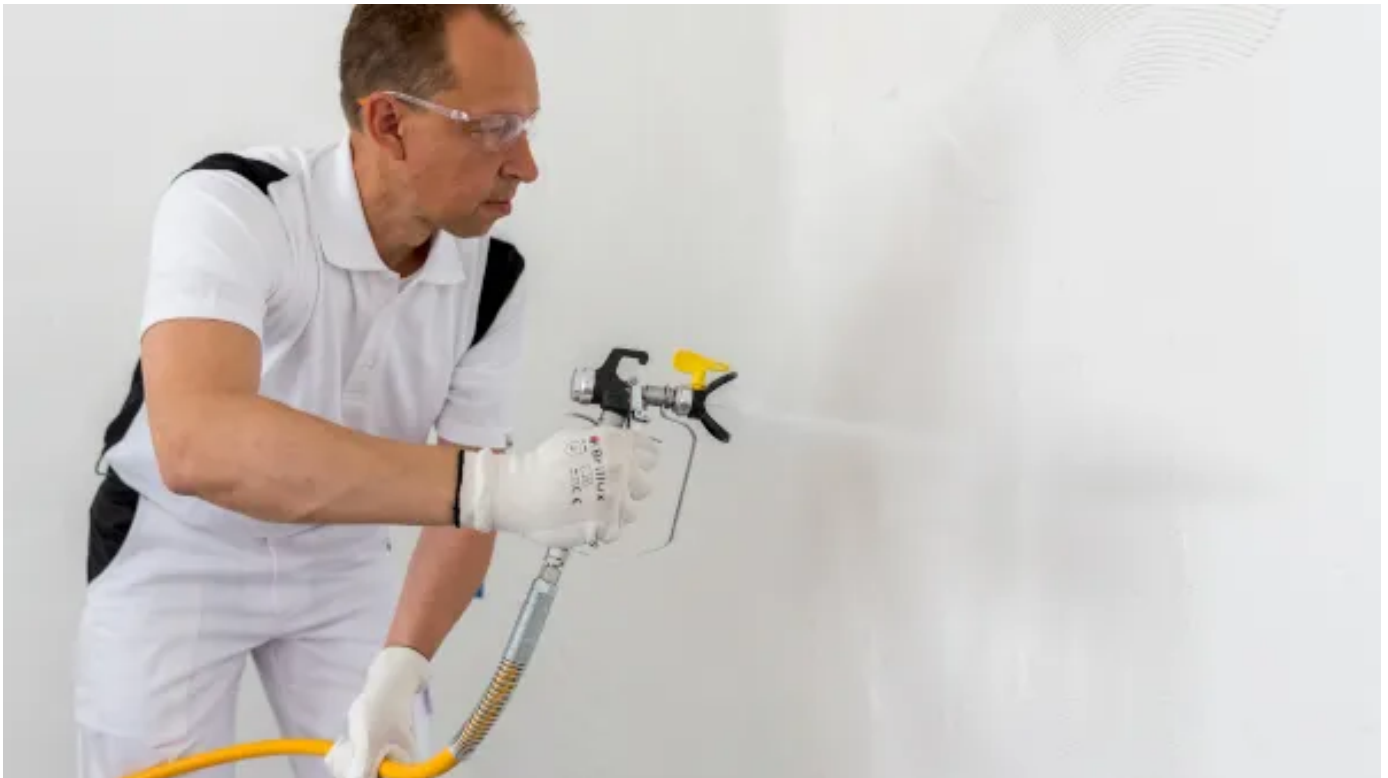
Verarbeitungstipps im Video

Verarbeitungstipps für die Erstellung eines glatten Untergrundes mit Glasfaser-Spachtelvlies-Einbettung.