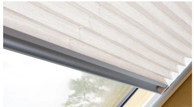
Der Faltstore APS bewirkt sanftes, gedämpftes Licht und ein attraktives, harmonisches Farbenspiel im Raum.