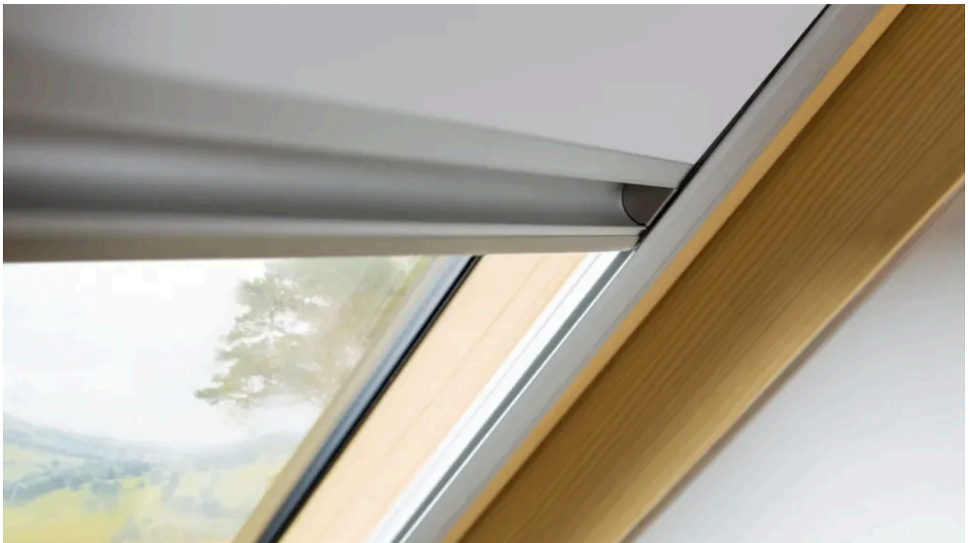
Die Dachfenster-Rollos ARF und ARP verfügen über seitliche Führungsschienen und sind stufenlos verstellbar.