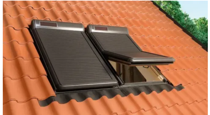
Der elektrische Außenrollladen ARZ Solar wird mit einer integrierten Solarbatterie geladen.

Weitere Informationen: Außenrollladen ARZ