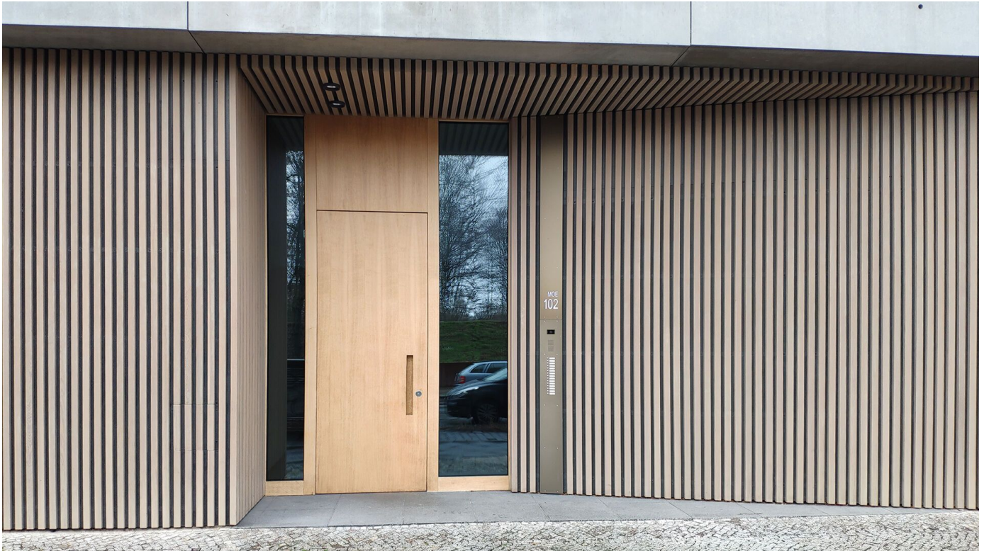
Sonderanfertigungen Türstationen mit individuellen Tableaus

Aus der Serie Türkommunikation – Türstationen von SKS-Kinkel Elektronik