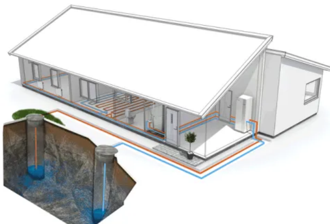
Systemdarstellung: NIBE Sole/Wasser-Wärmepumpe F1245 mit integriertem Brauchwasserspeicher, Grundwassersystem mit Saug- und Schluckbrunnen als Wärme- bzw. Kühlquelle