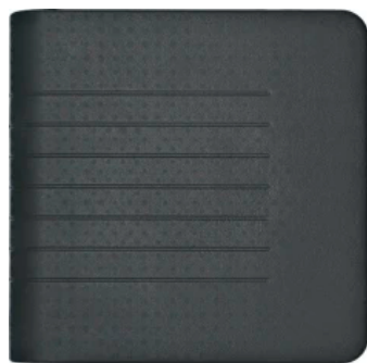
Grundwasserstation GWS 1/2

Leistungsgeregelte Inverter Sole-Wasser-Wärmepumpe zur Innenaufstellung mit integriertem Warmwasserspeicher und hohem Integrationsgrad. Zusätzlich integrierter Wärmeübertrager für eine energieeffiziente passive Kühlung über eine Flächenheizung. Monovalenter Einsatz für den Heiz- und Warmwasserbetrieb möglich. Geeignet für den Einsatz in Neubauten oder Gebäuden mit geringer Systemtemperatur. Je nach Heizlast des Gebäudes auch für Mehrfamilienhäuser einsetzbar. Die kompakte Bauart bedarf nur einer sehr geringen Aufstellfläche.