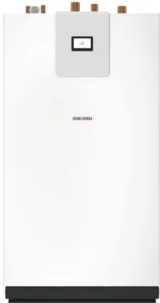
WPE-I 33/44/59/87 H 400 Premium

Aus der Serie STIEBEL ELTRON Wärmepumpen von STIEBEL ELTRON