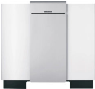
WPF 20 / 27

Die Sets bestehen jeweils aus zwei Wärmepumpen der Modulbaureihe sowie der Kompaktinstallation und dem Wärmepumpen-Manager WPM.