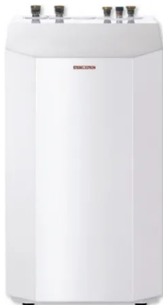
WPF 10-16 M

Die WPF ist eine Wärmepumpe für Heizung und Warmwasser, serienmäßiger Vollaussattung.