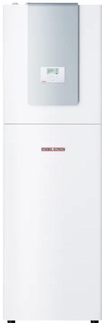
WPE-I 04/06/08/12/15 HKW 230 Premium

Aus der Serie STIEBEL ELTRON Wärmepumpen von STIEBEL ELTRON