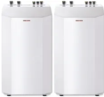
WPF 20-32 Set

Aus der Serie STIEBEL ELTRON Wärmepumpen von STIEBEL ELTRON