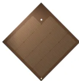
SunStyle® 745 Terracotta Brown | Entwickelt für denkmalgeschützte oder historische Gebäude.