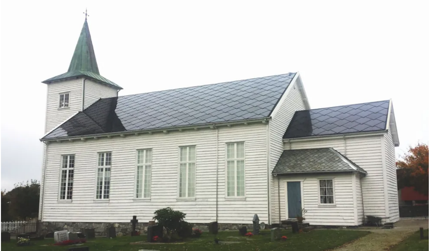
Strand Kirche in Tau aus dem 19. Jahrhundert

Aus der Serie Das SunStyle Solardach von SunStyle