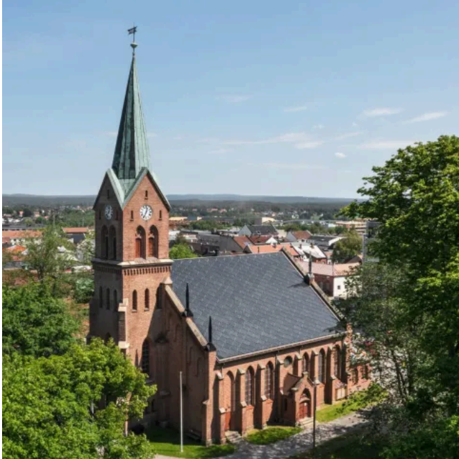
SunStyle-Solardachziegel mit niedrigem Profil in der Farbe Grey

Aus der Serie Das SunStyle Solardach von SunStyle