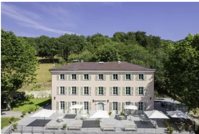
Das Wohnhaus wurde mit einem Solardach in Terrakotta-Farbe ausgestattet

Die SunStyle®-Solarziegel werden in Châtelleraut in der französischen Region Vienne hergestellt und decken das vierseitige Dach des Anwesens ab.