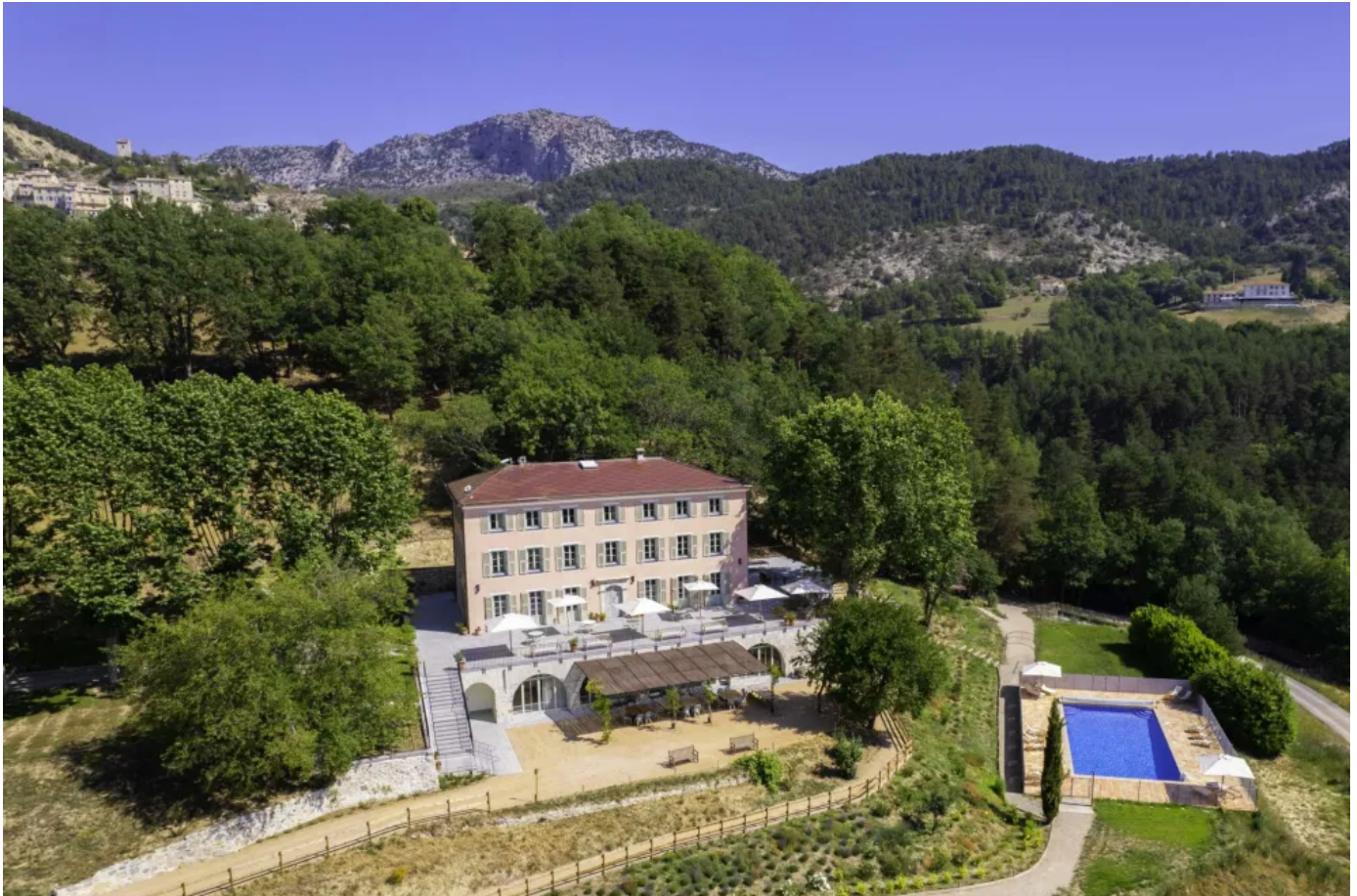
Je nach Objekt lässt sich ein farblich passender Ziegel in die historisch vorhandene Architektur einsetzen

Aus der Serie Das SunStyle Solardach von SunStyle