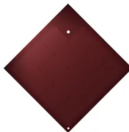
SunStyle® 745 Terracotta Red | Entwickelt für denkmalgeschützte oder historische Gebäude.