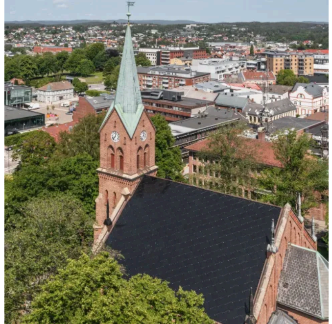
Solarenergie nutzen und gleichzeitig die historische Architektur des Gebäudes erhalten