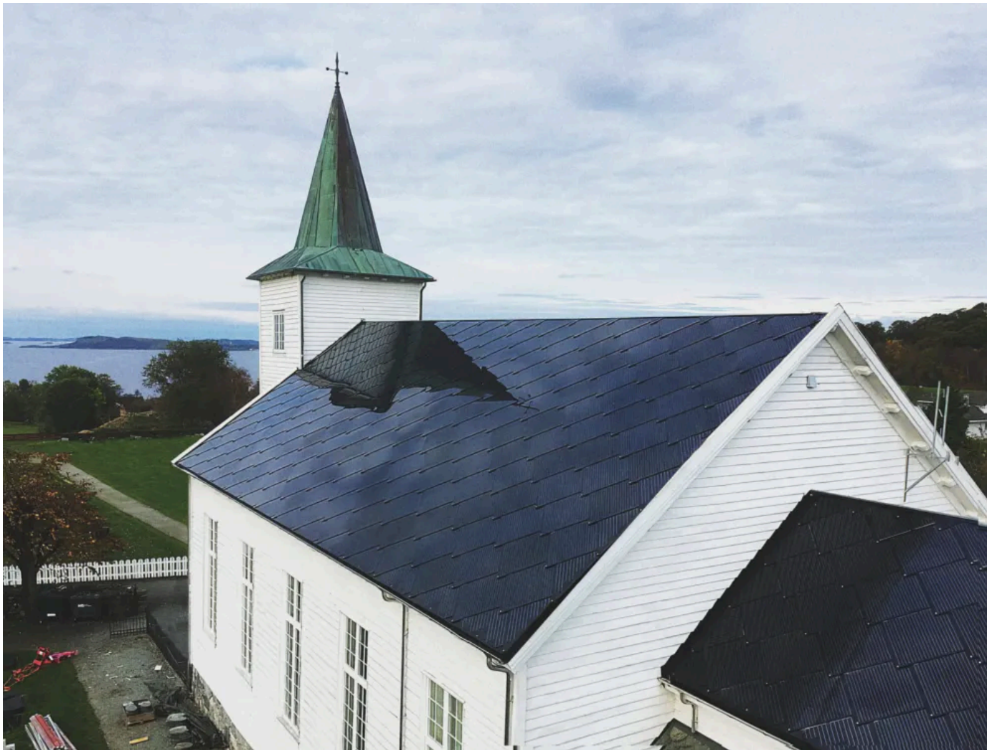
Das ursprüngliche Schindeldach wurde durch Solardachziegel von SunStyle ersetzt

Aus der Serie Das SunStyle Solardach von SunStyle