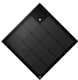
SunStyle® 745 Black | Erhältlich auch in Black Antiglare (blendfrei).