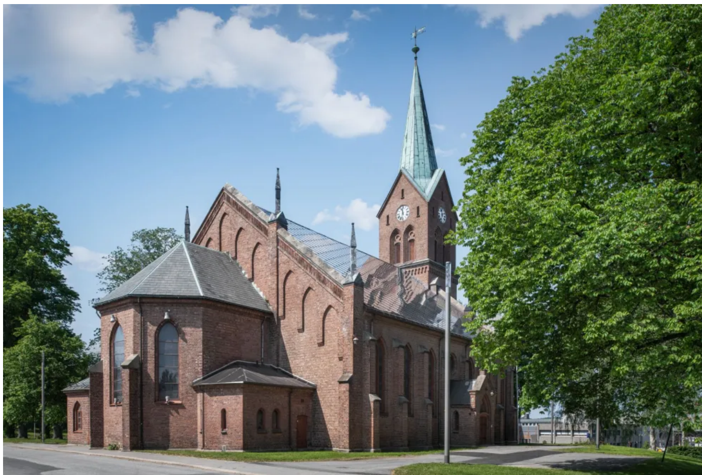
Die Kirche mit dem gebäudeintegrierten Photovoltaik-Solardachziegeln

Die Kirche, die nach einem Brand 1862 neu aufgebaut wurde, erfuhr im Laufe der Jahre mehrere Renovierungen, die immer darauf bedacht waren, das historische Erscheinungsbild zu bewahren.