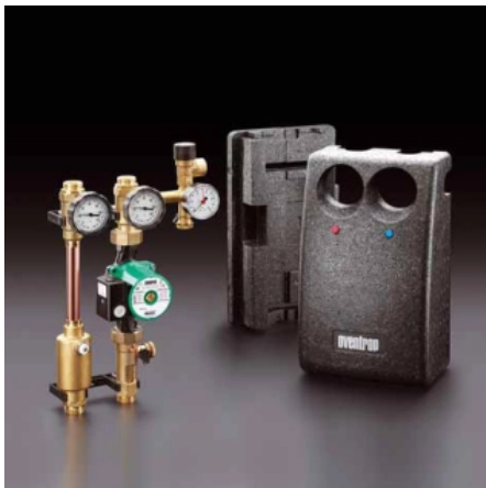
Regusol 180 - Station zur Verbindung von Kollektor und Speicher