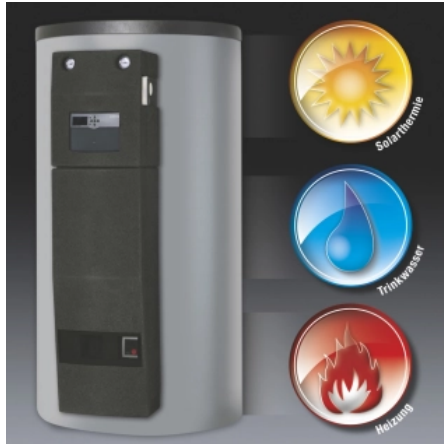
Regucor WHS Energiespeicher-Zentrale

Die Energiespeicher-Zentrale besteht aus einem Heizwasser-Speicher mit effizienter Wärmeschichtung und auf diesen hydraulisch abgestimmten Armaturen. Ein integrierter Systemregler liefert durch sein Wärmemanagement ein optimiertes Zusammenwirken der Funktionen aller Armaturen mit dem Heizwasser-Speicher. Durch den Einsatz des „Regucor WHS“ werden Montagezeiten und Platzbedarf minimiert. Die Einbindung von unterschiedlichen Wärmeerzeugern ist möglich.