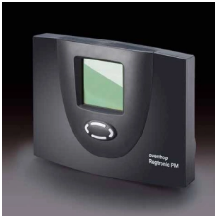
Multifunktionsregler mit vorinstallierten Schaltschemen zur Steuerung einer solarthermischen Anlage und Heizkreisreglung

Diese Stationen gibt es wahlweise mit oder ohne elektronischem Regler. Die Wärmeübertrager dient zur kontrollierten Übertragung der Wärmeenergie des Solarkreislaufes (Primärkreis) an z.B. einen monovalenten Speicher (Sekundärkreis); z.B. für bestehende Speicher ohne direkten Solarkreisanschluss. Komplett vormontierte und auf Dichtheit geprüfte Einheit. Im Vorlauf des Sekundärkreises ist ein 3-Wegeventil integriert. Dadurch kann für eine Schichtladung des Speichers sowie für die thermische Aufladung eines weiteren Speichers auch auf einen zusätzlichen parallel angeordneten Ladekreis umgeschaltet werden.