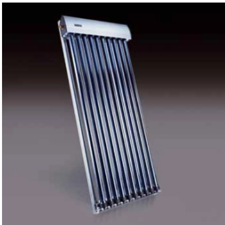
Röhrenkollektor OKP mit 10 Heat-Pipe-Röhren

Neben Solarkollektoren mit hohem Wirkungsgrad sind für eine effiziente "Energiegewinnung" genau angestimmte und präzise arbeitende Regler notwendig. Die elektronischen Solarregler werden für unterschiedliche Anlagenkonzepte angeboten. Besonders flexibel ist das Modell „Regtronic PM“. Dieser Multifunktionsregler zur Steuerung einer solarthermischen Anlage und Heizkreisregelung dient zur Verwirklichung komplexer Regelungen durch die Kombination von vorprogrammierten Schaltschemen mit frei einstellbaren Zusatzfunktionen.