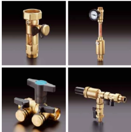
Umfangreiche Zubehörprogramm für die sichere und dauerhafte Installation von Solarthermieranlagen