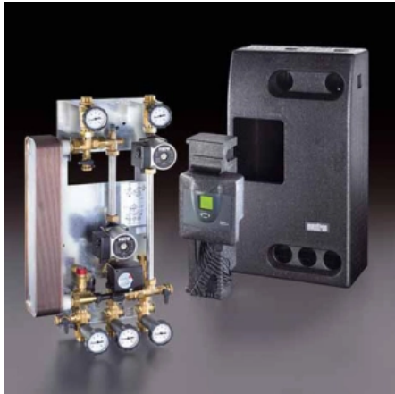
Regusol X-Station zur Verbindung von Kollektor und Speicher mit Wärmeübertrager