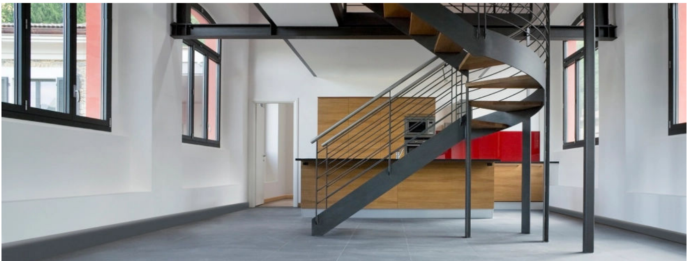
Fussboden- und Spezialprofile

Fussbodenprofile bieten Schutz an stark beanspruchten Stellen. Sie ermöglichen eine Verbindung von Übergängen oder die sichere Fixierung von unterschiedlichsten Belägen auf Treppen. Wand und Spezialprofile sorgen für saubere Abschlüsse an Wänden, Türrahmen und Heizungsrohren.