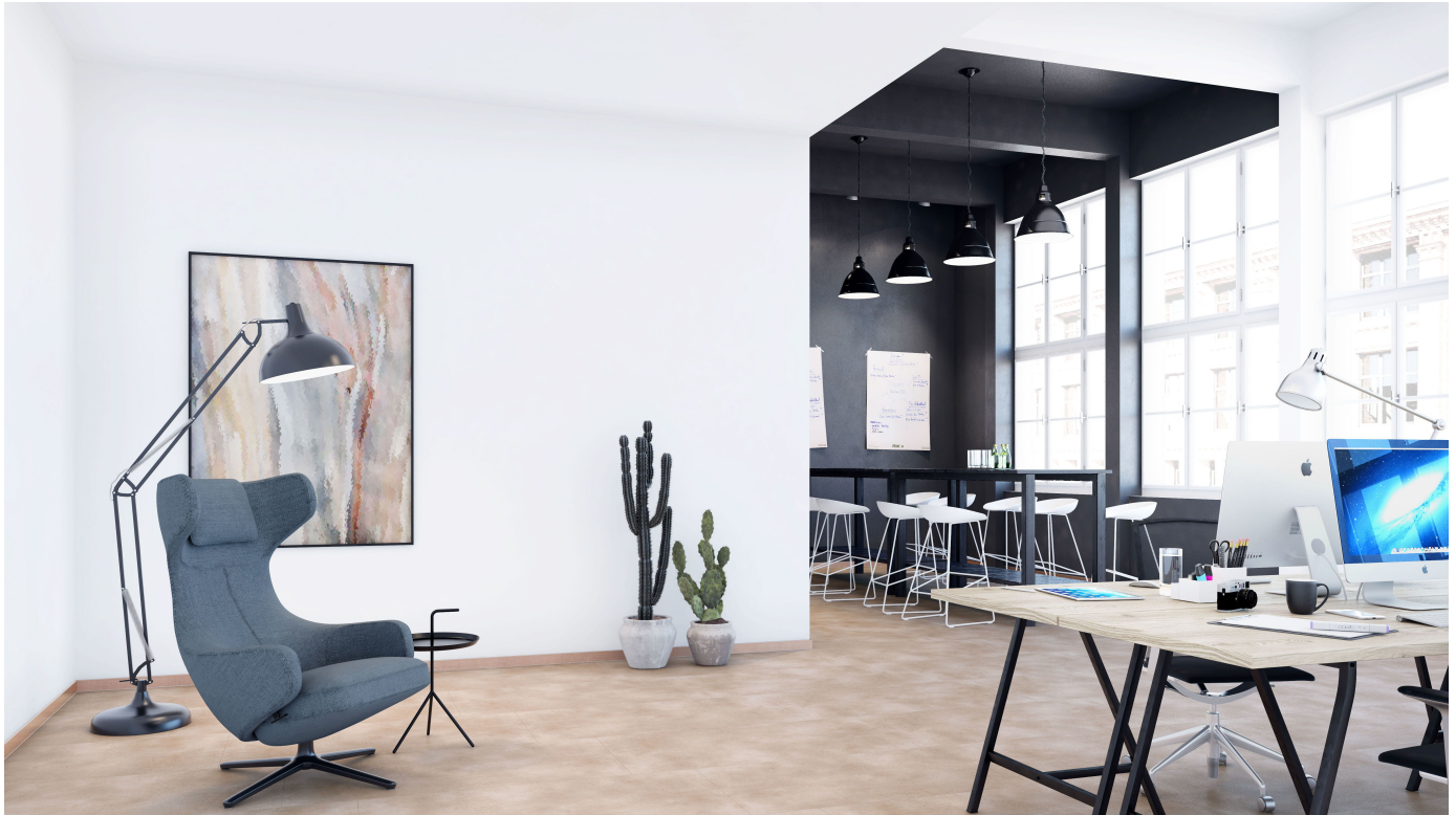
Sockelleisten und weitere Profile für den Innenausbau

Aus der Serie Sockelleisten und weitere Profile für den Innenausbau von Döllken Profiles