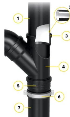
Kompatibel mit allen Sita Freispiegelgullys: SitaPipe PP Rohrsystem