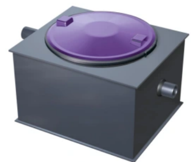
Sinkstoffabscheider zur Freiaufstellung

KESSEL bietet Sinkstoffabscheider und Schlammfänge in verschiedenen Größen zur freien Aufstellung sowie auch zum Erdeinbau an.