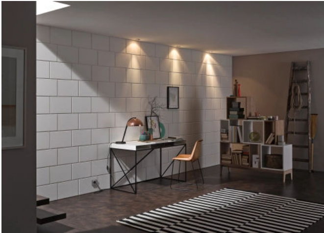
Wohnen: Schattenwirkung des KS* Faserstein

Aus der Serie Sichtmauerwerk aus Kalksandstein von KS-ORIGINAL