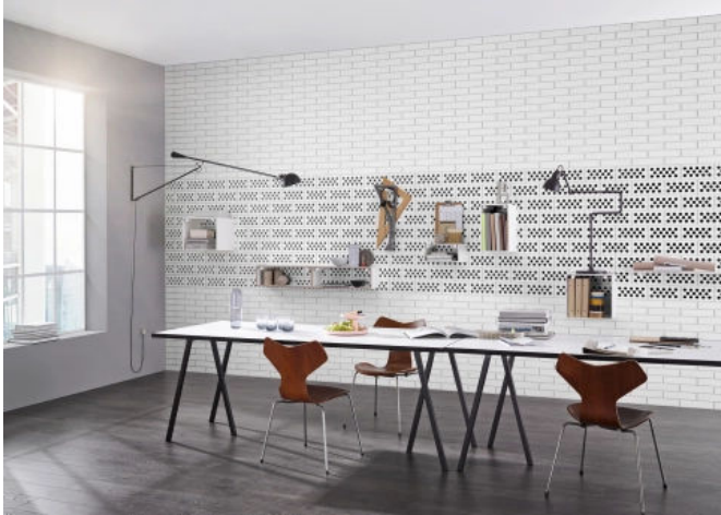
Büro: KS Verblender, teils hochkant mit sichtbarer Lochung

Aus der Serie Sichtmauerwerk aus Kalksandstein von KS-ORIGINAL