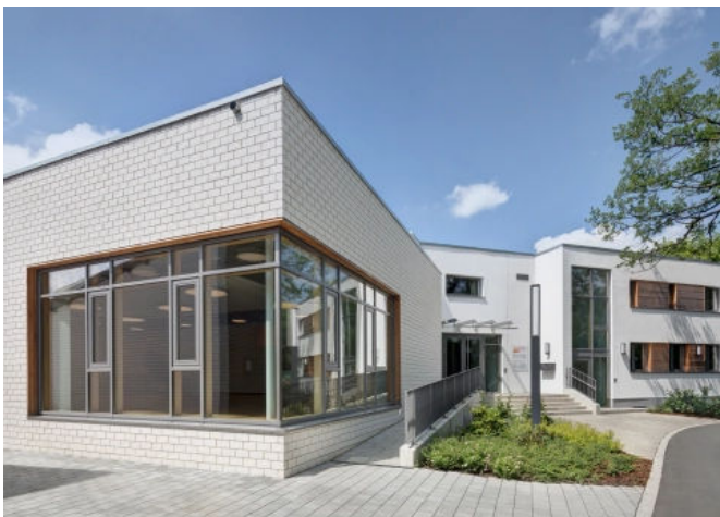
KiTa St. Konrad in Hof