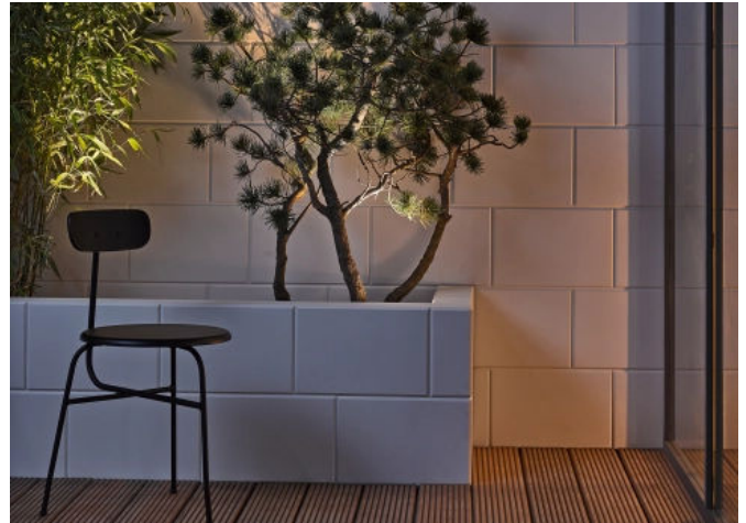
Terrasse: KS* Faserstein im Außenbereich

Durch die umlaufende, abgeschrägte Fase an den Kanten des Steines und die Verlegung der Steine in Dünnbettmörtel, übernimmt die Fase die Funktion der klassischen Sichtfuge. Im Abstand von 12,5 cm sind im Mauerwerk Installationskanäle angeordnet, sodass alle Elektroleitungen direkt zu den Steckdosen, Schaltern und Lampen durchgezogen werden können, ohne dass die Wandoberfläche aufgeschlitzt bzw. zerstört werden muss.