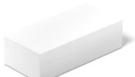
KS-Verblender (KS Vb) und KS-Vormauersteine (KS Vm) nach DIN V 106