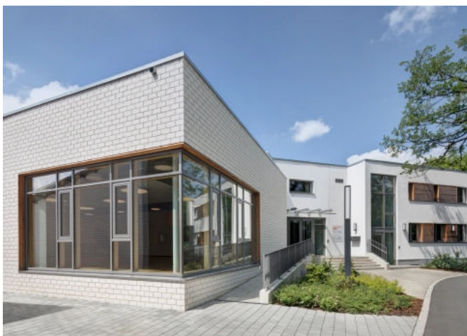
KiTa St. Konrad in Hof