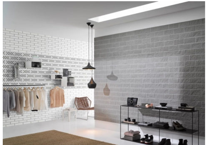
Shop: KS Verblender mit grauer, bruchrauer Oberfläche

KS Verblender sind mit glatter, bruchrauer oder bossierter Oberfläche erhältlich. Um seine raue Oberflächenstruktur zu erhalten, wird dazu der bruchraue Verblender während des Produktionsprozesses an der Sichtfläche gebrochen. Bossierte Verblender werden zusätzlich beschlagen. Die der Natur nachempfundene Sichtflächenstruktur ist dadurch stärker gewölbt und verleiht der Wandfläche eine stärkere Tiefenwirkung.