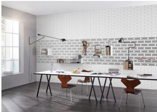
Büro: KS Verblender, teils hochkant mit sichtbarer Lochung

Aus der Serie Sichtmauerwerk aus Kalksandstein von KS-ORIGINAL