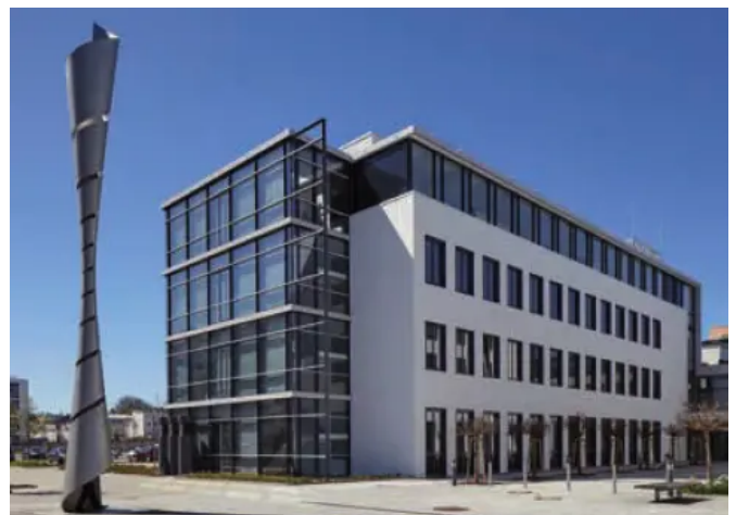
Architekturbüro: Ermel Horinek Weber AS PLAN Architekten, Kaiserslautern