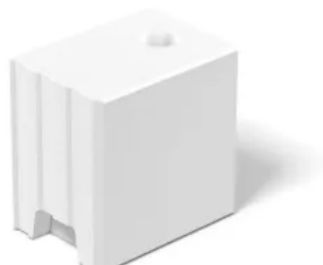
KS-Fasensteine (KS F) nach DIN V 106

Durch die umlaufende, abgeschrägte Fasse an den Kanten des Steines und die Verlegung der Steine in Dünnbettmörtel, übernimmt die Fasse die Funktion der klassischen Sichtfuge. Im Abstand von 12,5 cm sind im Mauerwerk Installationskanäle angeordnet, sodass alle Elektroleitungen direkt zu den Steckdosen, Schaltern und Lampen durchgezogen werden können, ohne dass die Wandoberfläche aufgeschlitzt bzw. zerstört werden muss.