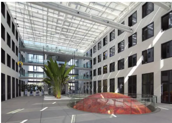
KS Fasenstein: Fraunhofer-Zentrum Kaiserslautern