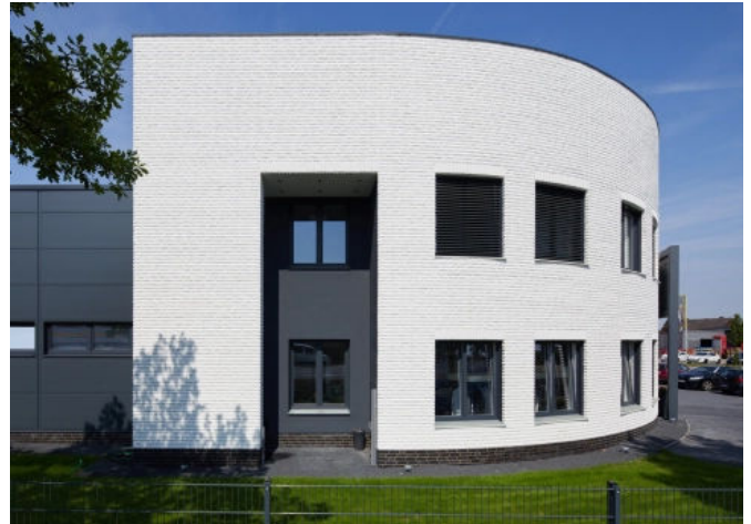
Wäscherei Markus in Lohne