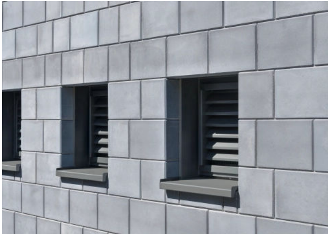
Büro Graf

Aus der Serie Sichtmauerwerk aus Kalksandstein von KS-ORIGINAL