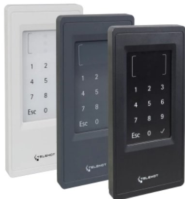
Zutrittskontrollleser crylock BLM 10 D

Aus der Serie Alarmanlagen zum Schutz vor Überfall, Einbruch und Brand von Telenot Electronic