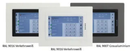
BT 800

Das Bedienteil BT 800 Funktionen ermöglicht folgende Funktionen