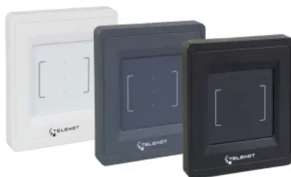
Zutrittskontrollleser crylock BLM 10 D

Die TELENOT-Einbruchmeldeanlage ist besonders nutzerfreundlich und wird ohne Schlüssel am Zutrittskontrollleser scharf geschaltet.