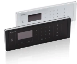
Funk-Bedienteil FBT 250

Das FBT 250 ermöglicht die gezielte Bedienung aller Sicherungsbereiche über die integrierte Tastatur oder über den integrierten RFID-Leser mit Mifare DESFire Transpondern (mit oder ohne AES-Verschlüsselung).