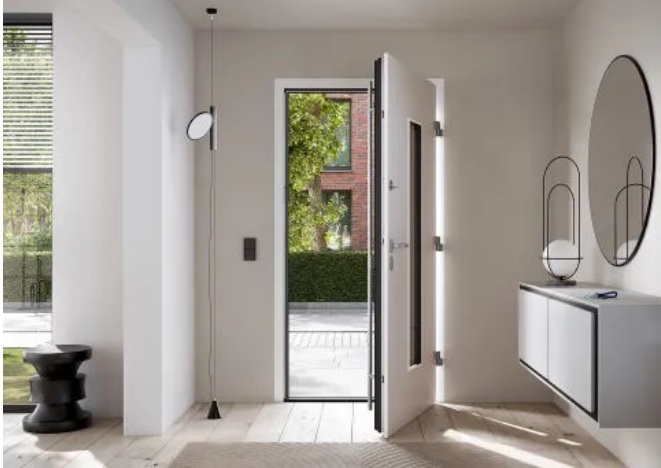
Sicherheit, Dichtschluss, Komfort – autoLock AV4D vereint alles.

Aus der Serie Moderne Türverriegelungen für anspruchsvolle Sicherheitsansprüche von Aug. Winkhaus