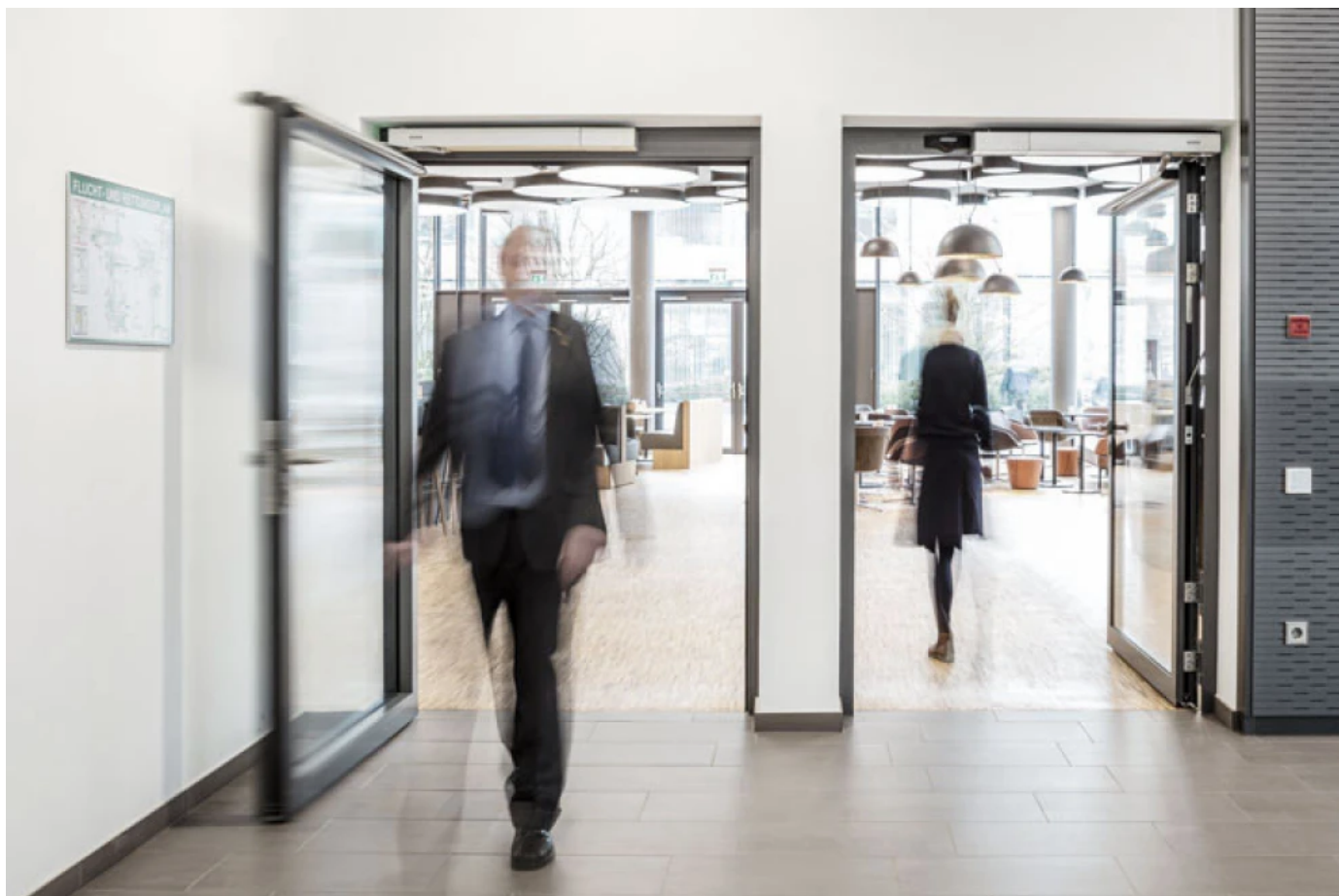
Selbstverriegelnde Panikschlösser, © GEZE GmbH / Jürgen Pollak