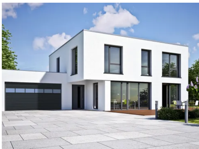
Mittelsicke mit Alulichtband