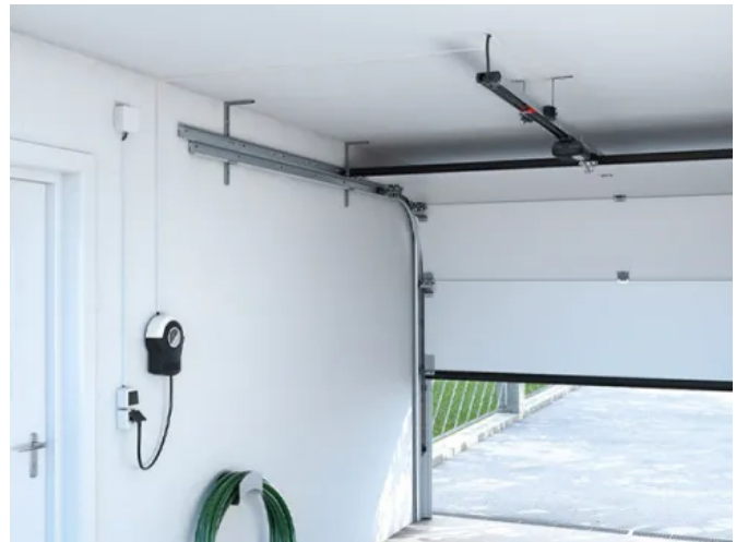
Antrieb CarTeck DRIVE pro+

Weitere Herstellerinformationen zu Antriebstechnik