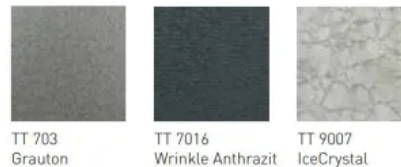
Holzdekore und Metalltöne