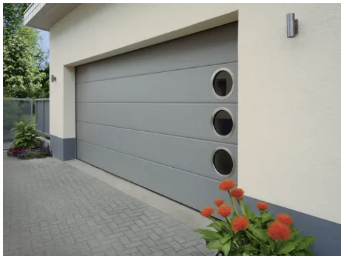
ohne Sicke mit Rundverglasung

Aus der Serie Tore und Toranlagen von Teckentrup Door Solutions