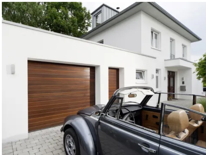
Sicke in Holzdekor Mahagoni