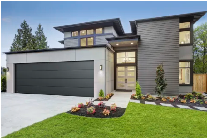
Garagen Sektionaltor XXL

Aus der Serie Tore und Toranlagen von Teckentrup Door Solutions