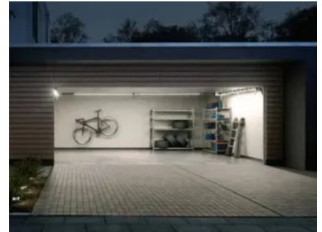
mit LED Beleuchtung innen