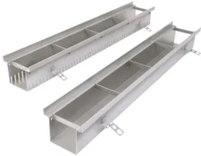
Schwerlast-Rinne „Stabile Magna“

Aus der Serie Drainage- und Entwässerungssysteme von Richard Brink