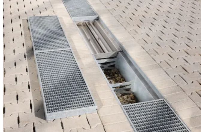
Die Rinnen eignen sich bestens für die Zwischenspeicherung großer Wassermengen und die anschließende, fortwährende Dränierung