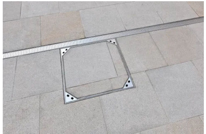
In zusätzlich verbauten Schachtabdeckungen lässt sich das Plattenmaterial des umgebenden Bodenbelags einlegen.