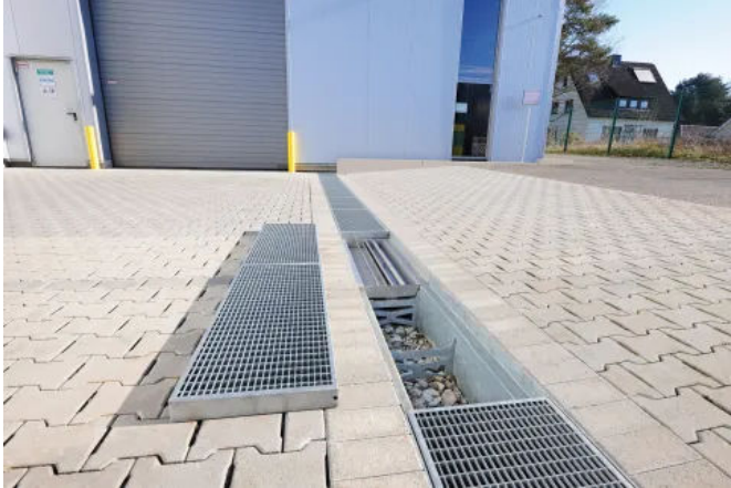
Es wurden versickerungsfähige Rigolenrinnen „RigoMax“ für eine 120 Quadratmeter große Pflasterfläche verbaut.

Aus der Serie Drainage- und Entwässerungssysteme von Richard Brink