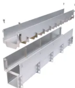
Schwerlast-Doppelschlitzrinne Gemini Magna

Im Fußgängerbereich des Einkaufszentrums kamen die Schwerlastrinnen „Stabile Magna“ mit einer Belastungsklasse von D 400 (entspricht einer Belastung von 40 t) sowie 3 Millimeter dicke Edelstahl-Roste mit kleinen rund ausgestanzten Perforationen als Abdeckung zum Einsatz.