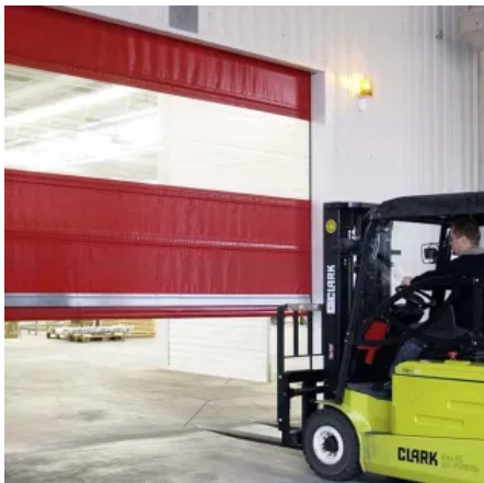
Folienschnelllaufter SLT 06 / 09 FU

Schnelllaufstore werden oft in Kombination mit anderen Industrietoren, wie z. B. Sektionaltore oder Rollstore, eingebaut. Teckentrup Schnelllauf-Folientore eignen sich für den robusten Dauereinsatz im Innen-/Außenbereich. Sie sorgen für einen reibungslosen Verkehrsfluss und reduzieren in der kalten Jahreszeit Energieverluste auf ein Minimum. Das integrierte Federkraft-Crash-Schutzsystem sorgt für Sicherheit und erhöht die Wirtschaftlichkeit der Toranlage. So öffnet sich der Rückhaltemechanismus automatisch beim Anfahren des Bodenabschlussprofils. Dabei springt die Führung unvermittelt in das Bodenabschlussprofil zurück und kann dann nach beiden Seiten aus den Führungen gedrückt werden. Dabei werden die Crash-Endstücke nicht belastet und haben dadurch eine sehr lange Lebensdauer. Mit dem integrierten Federkraft-Crash-Schutz schützen Teckentrup Schnelllaufstore Personen und Material, vermeiden somit Beschädigungen und Ausfallzeiten und sind schnell wieder funktionsbereit. Unfälle bleiben damit ohne schwerwiegende Folgen.