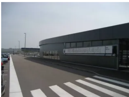
BMW Filiale Werk Leipzig