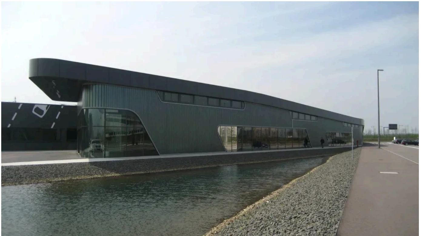
BMW Filiale Werk Leipzig