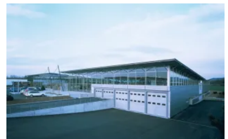
Kassettenwand mit Schuppenfassade, Dacheindeckung mit Foliendach