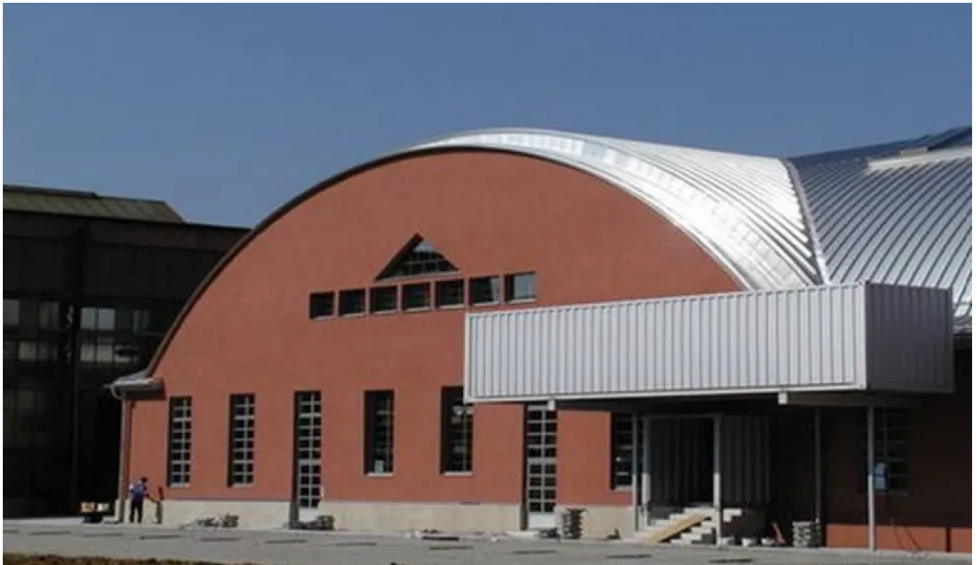
Zollinger Halle, Ludwigsburg