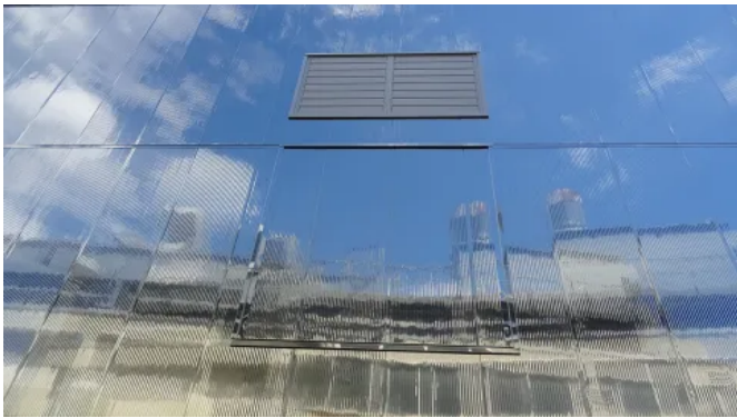
Reinraumfabrik Vishay FAB, Heilbronn