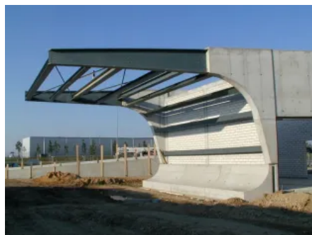
BMW Filiale Werk Leipzig