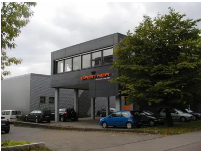
Breitner Abfüllanlagen GmbH