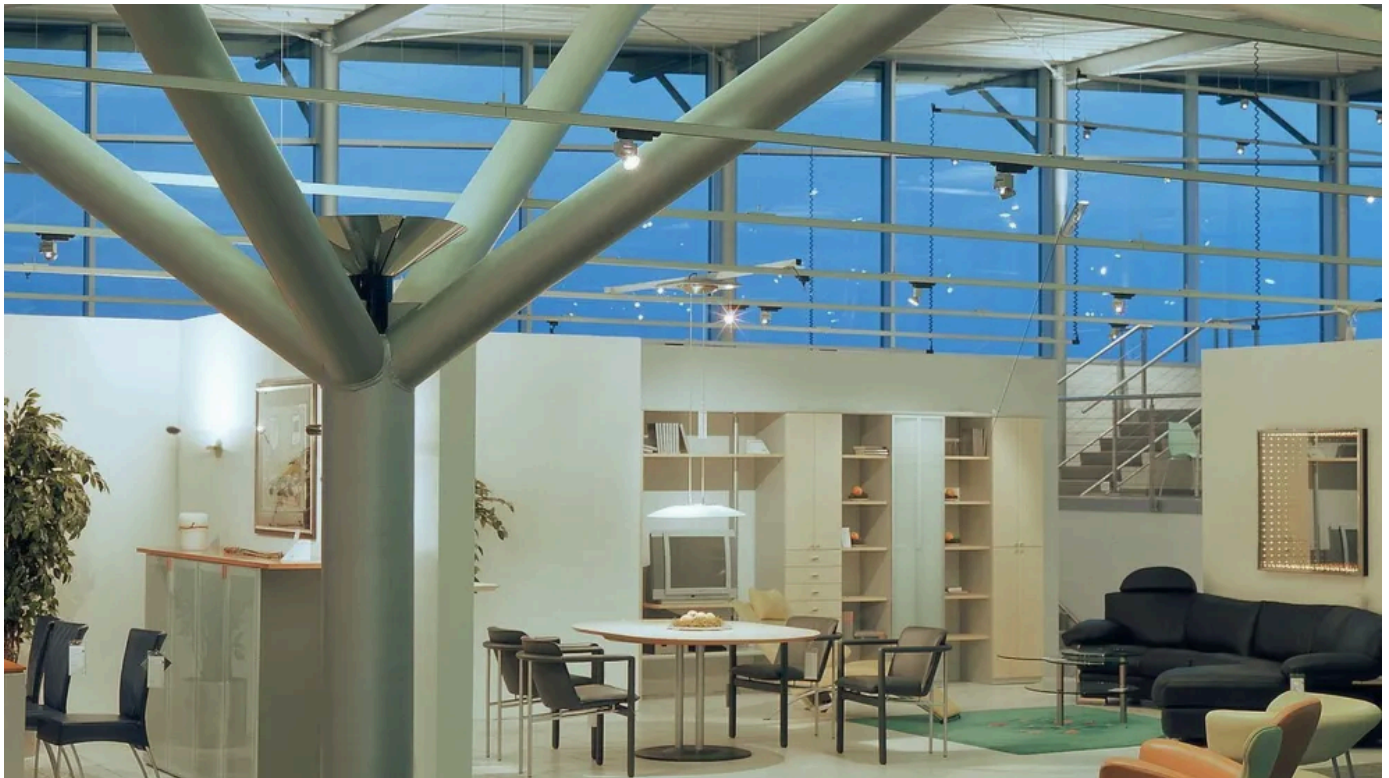
Jäger Einrichtungen; Architekten: Rainer Mockler, Heilbronn