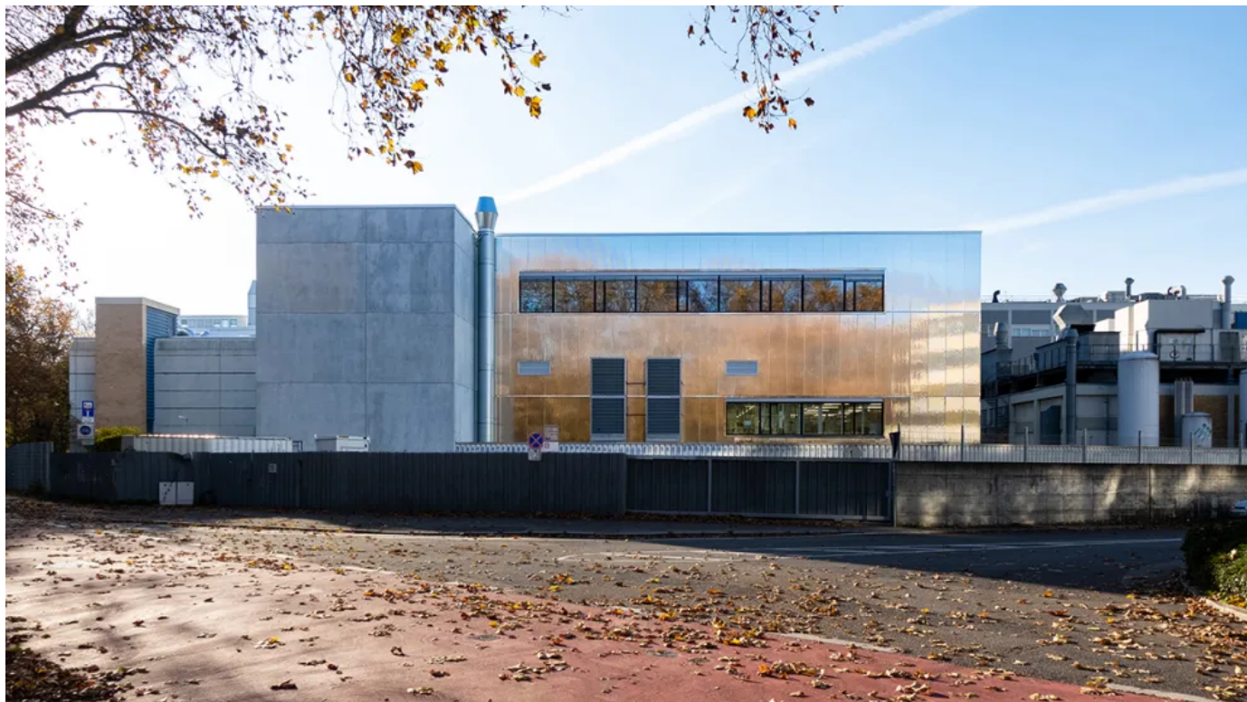
Reinraumfabrik Vishay FAB, Heilbronn; Planung: Geiselmann+Hauff Architekten, Plochingen

Neubau Reinraumfabrik Vishay FAB, Heilbronn