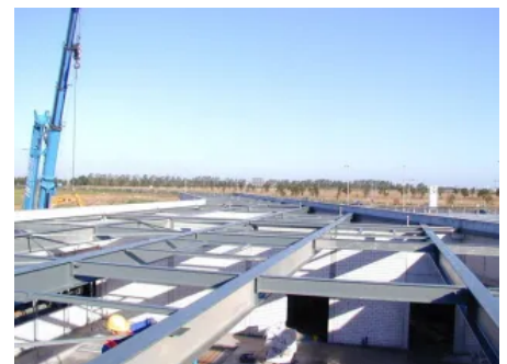
ca. 1.000 t Stahlbau für Montagehallen