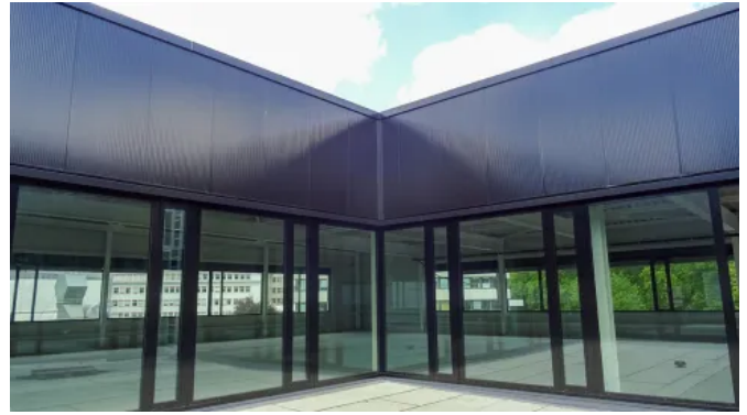
Reinraumfabrik Vishay FAB, Heilbronn