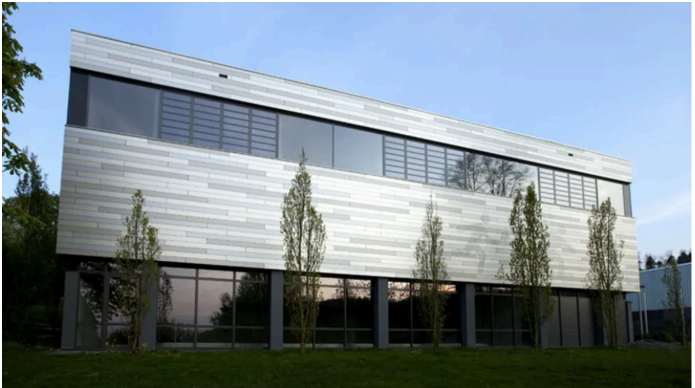
Turnhalle Nagold, Planung: Bonasera Architekten Nagold