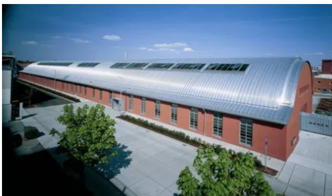
Zollinger Halle, Kalzip-Dach mit Glasoberlichtern