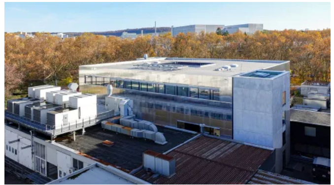
Reinraumfabrik Vishay FAB, Heilbronn