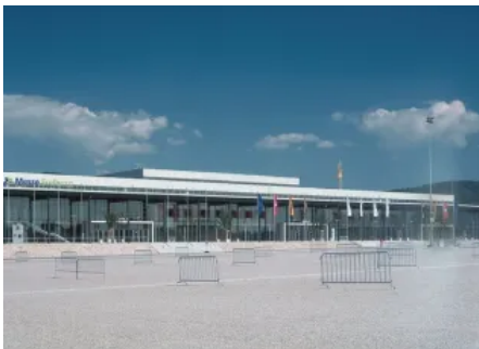
Falzdachfläche mit Reinacrylat-Kunstharzbeschichtung