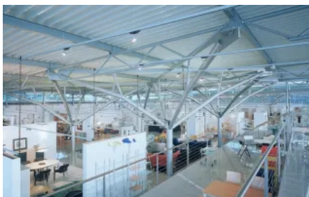
Stahlbau als Baumkonstruktion, beschichtet, 280 to