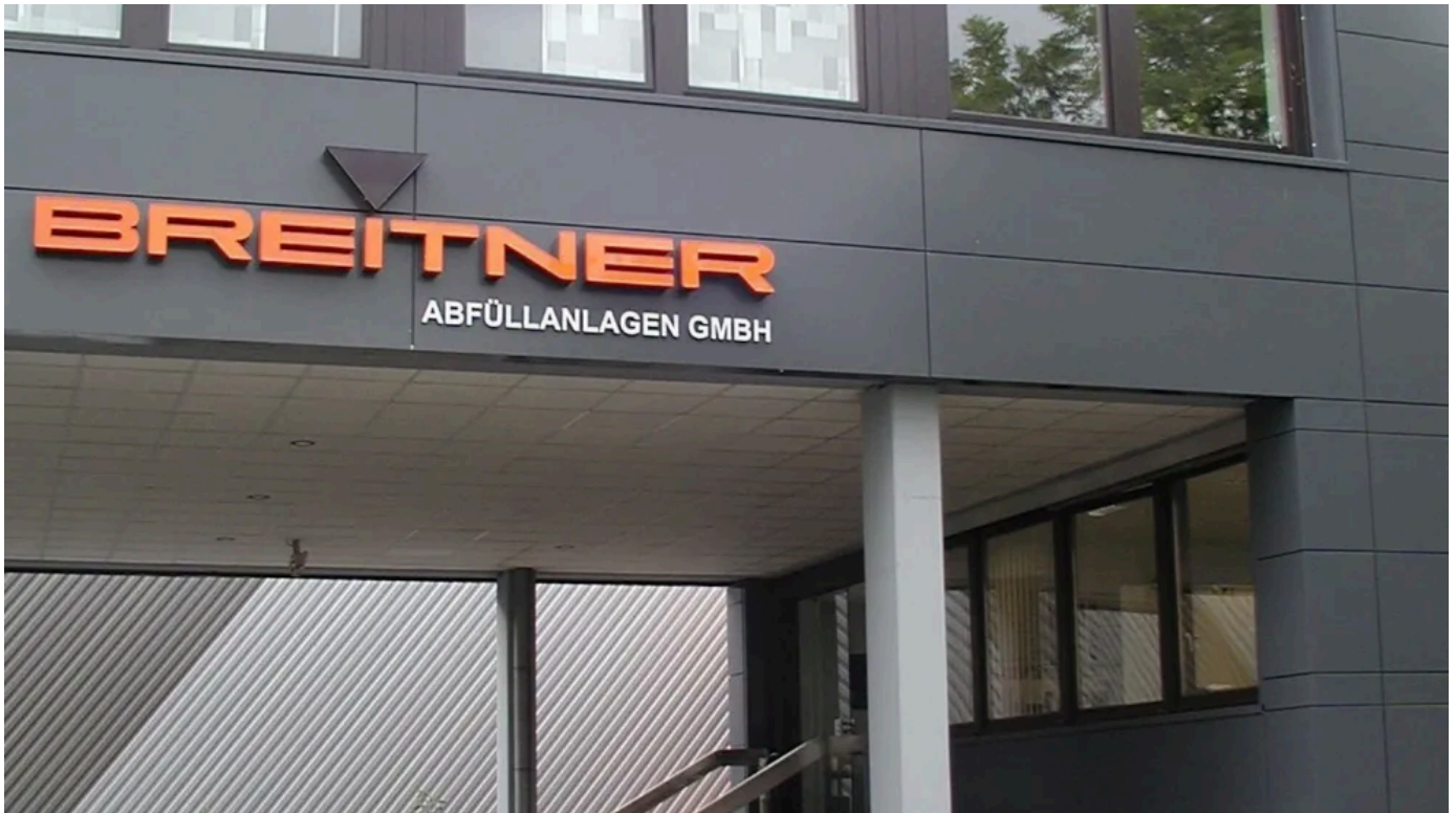
Breitner Abfüllanlagen GmbH; Architekt Wieland, Gaildorf

Breitner Abfüllanlagen GmbH, Schwäbisch Hall