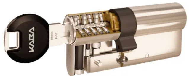
Schließzylindersystem Kaba penta