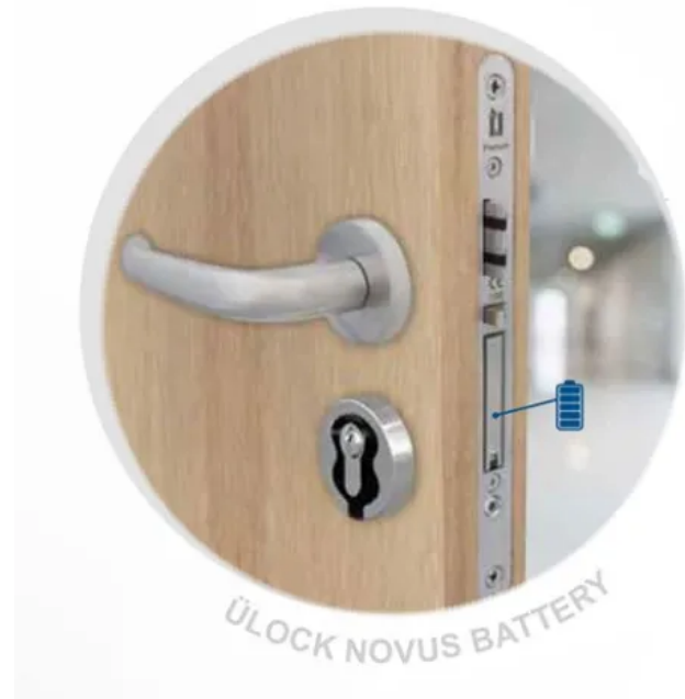
Ü-Lock Novus Battery: Batteriebetriebenes Elektronikschloss mit Zutrittskontrolle