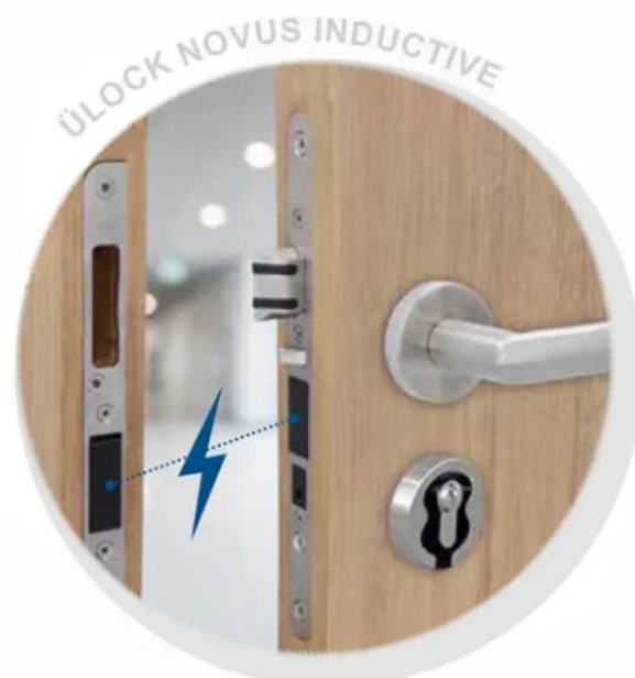
Ü-Lock Novus Inductive: Induktiv geladenes Elektronikschloss mit Zutrittskontrolle