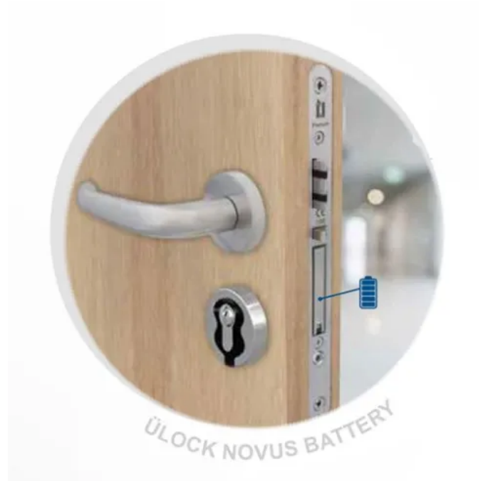
Ü-Lock Novus Battery: Batteriebetriebenes Elektronikschloss mit Zutrittskontrolle