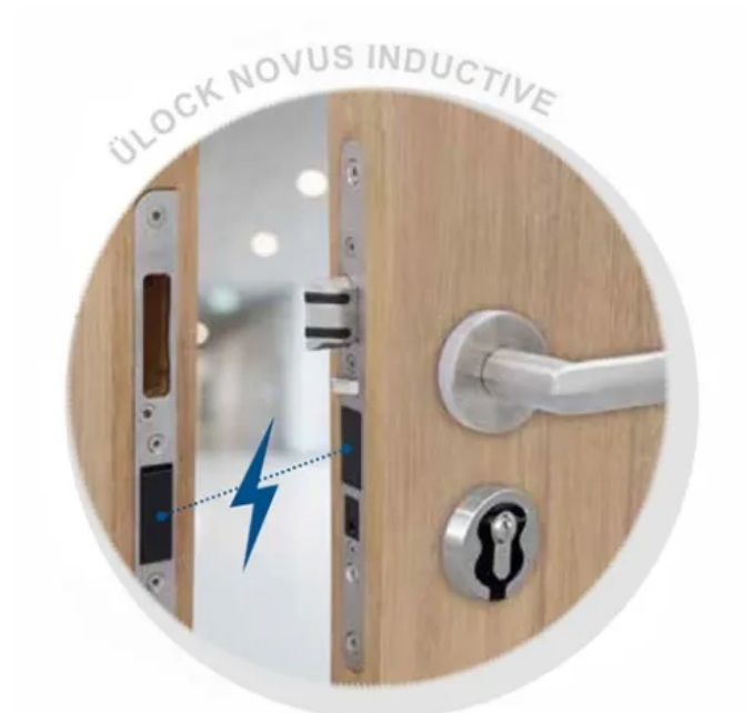
Ü-Lock Novus Inductive: Induktiv geladenes Elektronikschloss mit Zutrittskontrolle