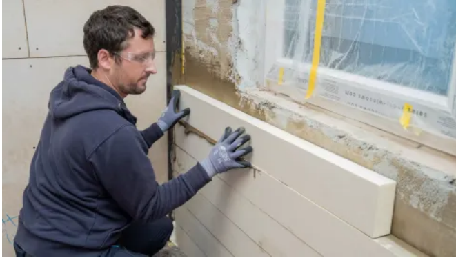
Langzeitlösungen mit Wärmedämmung - Saniersysteme mit Verbesserung des energetischen Standards

Aus der Serie Sanierung: Bautenschutz- und Instandhaltungssysteme von Remmers Gruppe SE