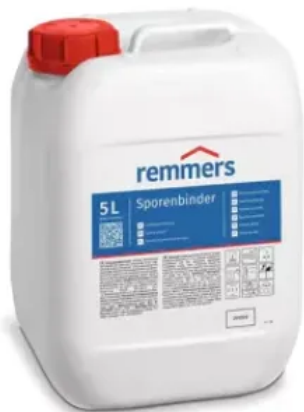
Sporenbinder | Lösemittel- und weichmacherfreie Spezialgrundierung zur Bindung von Schimmelpilzsporen