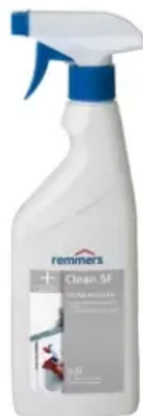
Clean SF | Zur Reinigung von mit Stockflecken befallenen Flächen

Mit Schimmelpilzen befallene Flächen kleineren Umfangs bis zu einer Größe von 0,5 m 2 , wie z. B. oberflächlicher Befall ohne Bauwerksmängel, können durch Privatpersonen ohne Beteiligung von Fachpersonal mit Clean SF gereinigt werden. Bei größerem Befall sollte eine Fachfirma hinzugezogen werden.