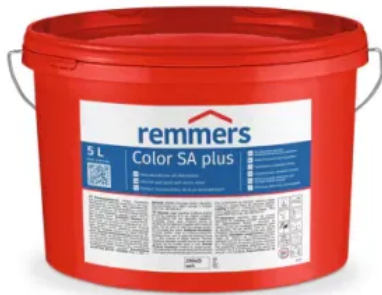
Schimmel-Protect Color SA plus | Emissionsarme Innenwandfarbe mit Mikrosilber als Filmschutz gegen Pilzbefall

Eine gute Maßnahme für schimmelpilzgefährdete oder belastete Räume, ohne Bauteildurchfeuchtungen und konstruktive Mängel, ist die Beschichtung mit Schimmel-Protect Color SA plus, das mit Hilfe von Silber gegen Mikroorganismen wirksam ist.